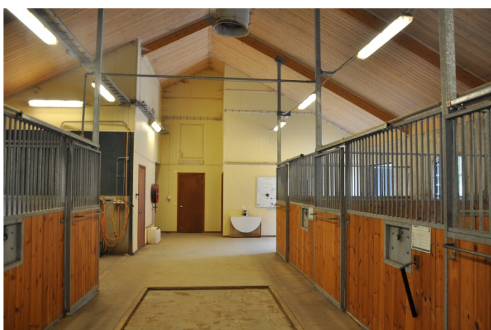
Invändigt i stall mot sadelkammare och fikarum.