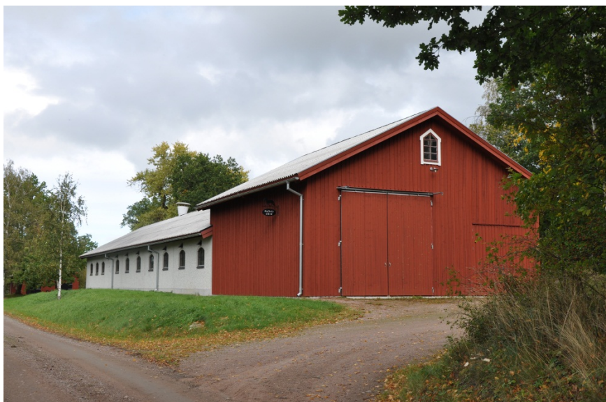
Utvändig vy mot foderutrymme på gavel av stall.