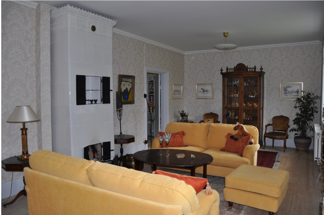
Sal på bottenvåningen.