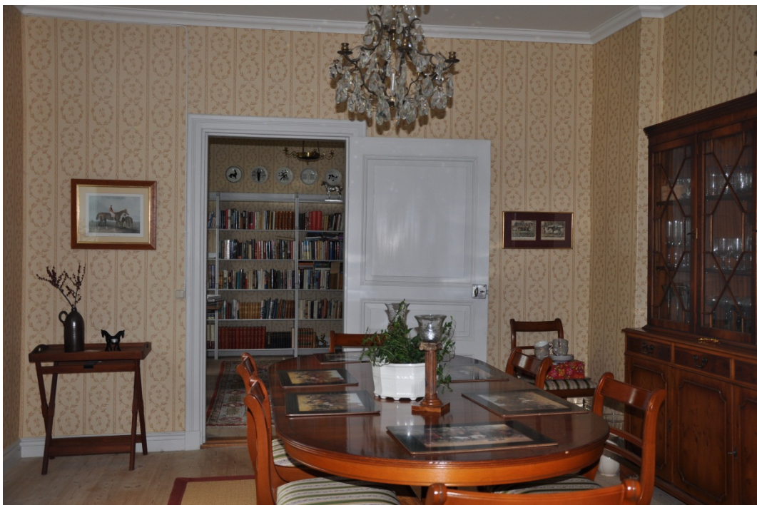
Matsal och bibliotek på bottenvåning.