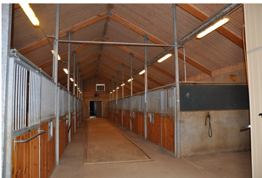
Invändigt i stall mot foderutrymme.