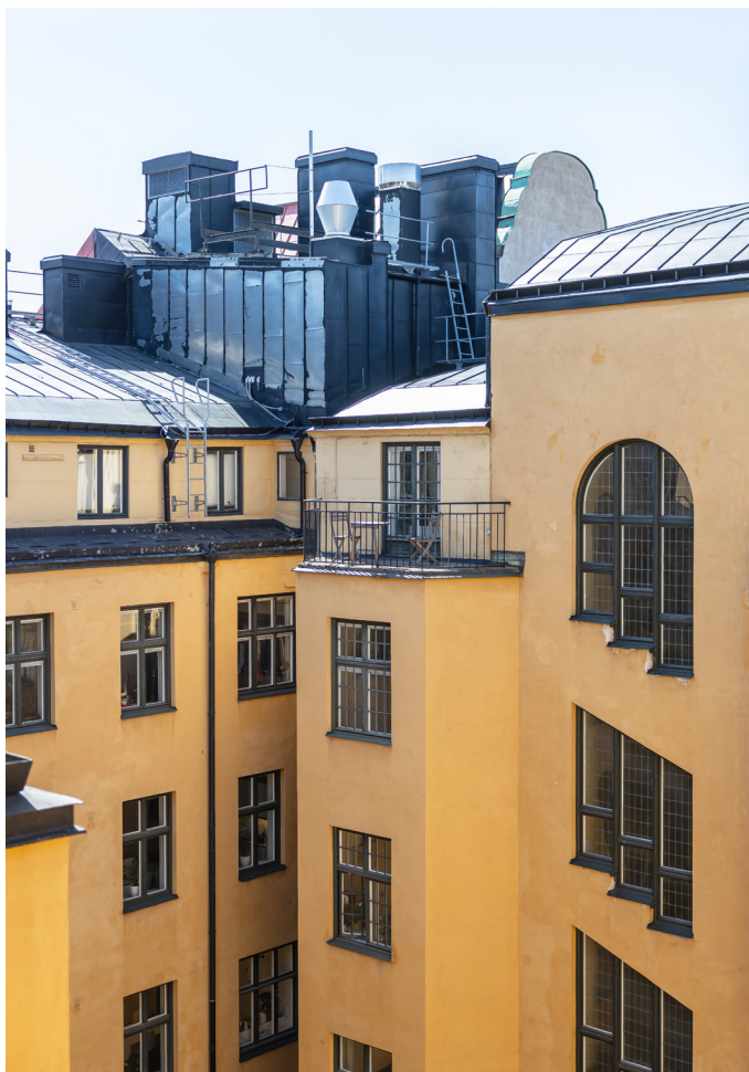
En av balkongerna mot innergården