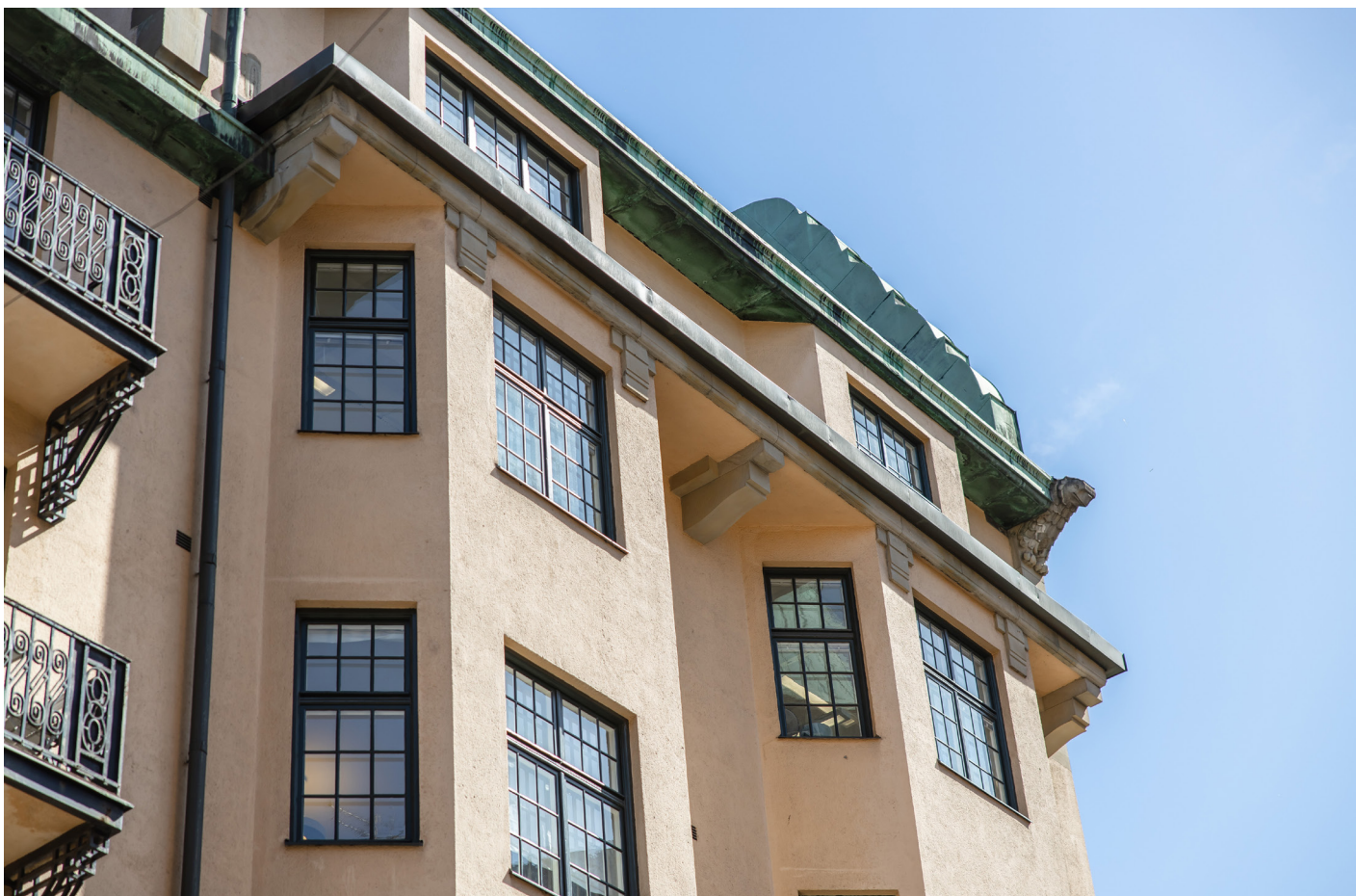
Kontor under takåsarna.