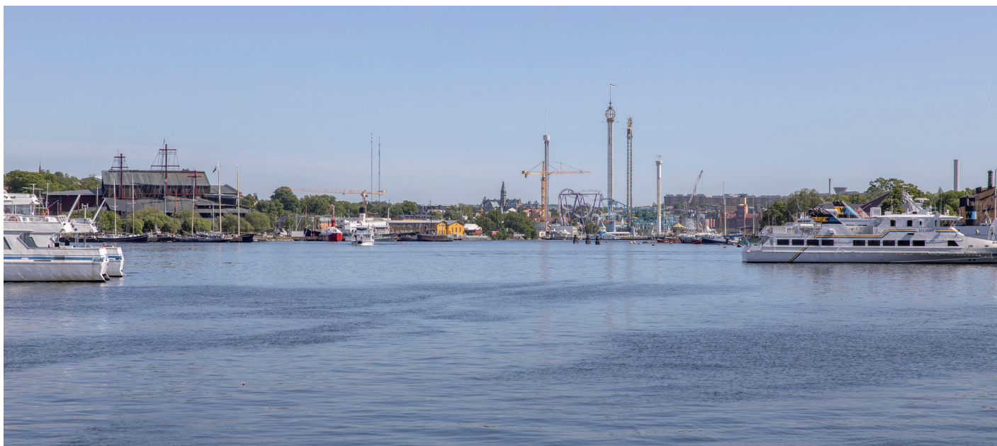
Läge nära Nybroviken.