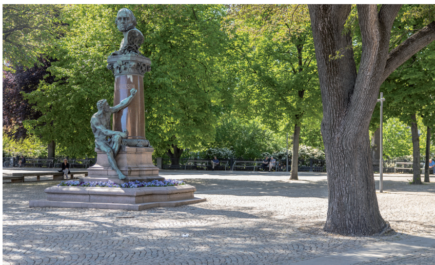
Berzelii park, en av de central belägna oaserna inom gångavstånd.