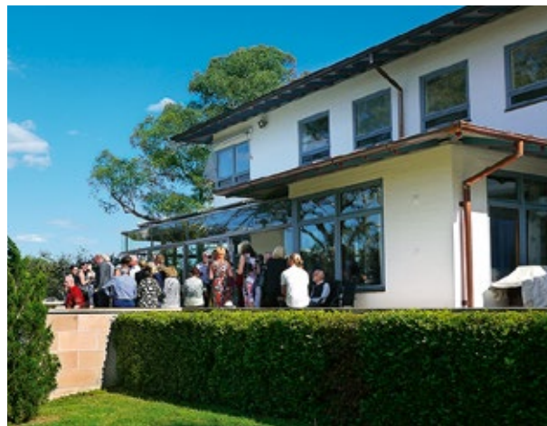
Ambassaden nyinvigdes i november.