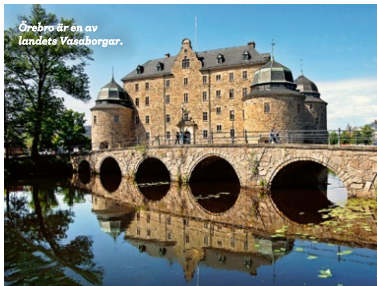
Örebro är en av landets Vasaborgar.