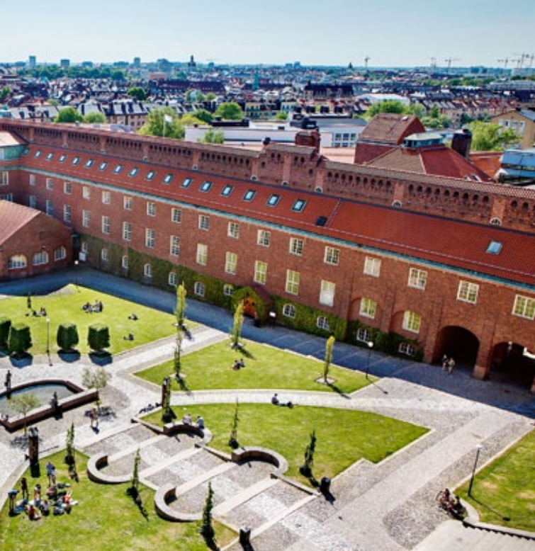
Erik Lallerstedts byggnader för Kungliga Tekniska Högskolan hör till de samtida byggnader som kvalade in som byggnadsminnesmärken tack vare höga konstnärliga kvaliteter.