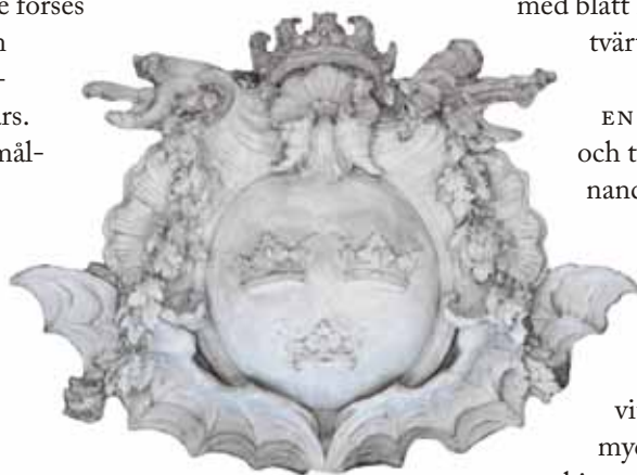
Lilla riksvapnet med krona.

Följande arbeten beslutades: Ommålning av taket, en försiktig rengöring av de väggytor och dekorationer som finns närmast taket samt lagning av skador på skulpturer och annan fast dekor i denna zon. Beslutet om bröllopsmiddagen ledde även till att de långtgående, golvfasta gradängerna temporärt skulle avlägsnas för att ge mera golvyta åt middagsgästerna.