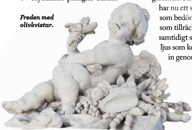
Freden med olivkvistar.

För närvarande planeras därför både ett nytt värmesystem, där varmluft via galler i golv ersätter de störande radiatorerna, och nya, lättare och mera mobila gradänger. När väl detta är på plats kommer alla turister åter att kunna uppleva ett av landets praktfullaste och symboliskt viktigaste rum, medan de som fått privilegiet att bli inbjudna på fest hos Kungen, kommer att få se Rikssalen i festskrud. *