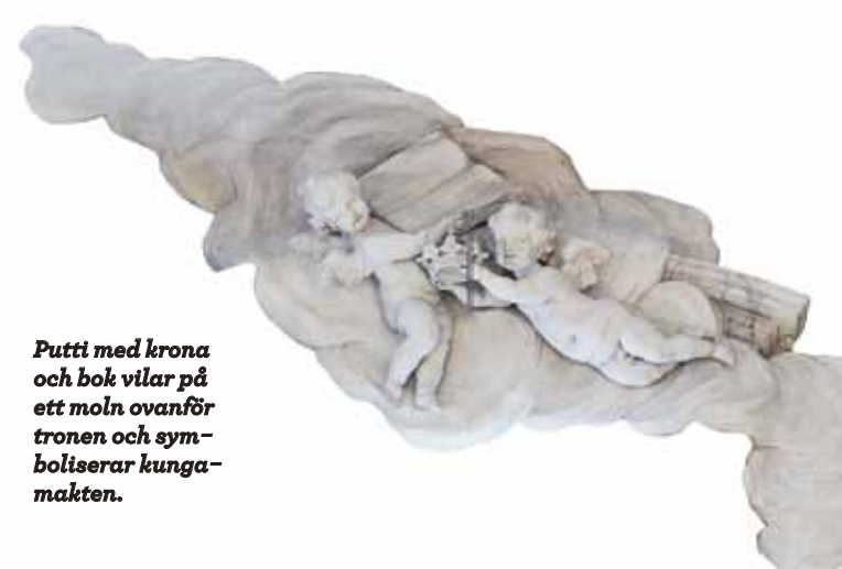
Putti med krona och bok vilar på ett moln ovanför tronen och symboliserar kungamakten.

var förbi, måste man ändå betrakta en hel del av det som Tengbom – mycket skickligt – genomförde på slottet som just stilrestaureringar. Det handlade om att sudda ut spåren efter det föraktade, sena 1800-talet, och återställa det beundrade 1700-talet. I ett viktigt avseende skilde sig Tengboms restaureringar från 1800-talets där nyskick eftersträvades i finishen; han månade om patinan, om upplevelsen av gången tid.