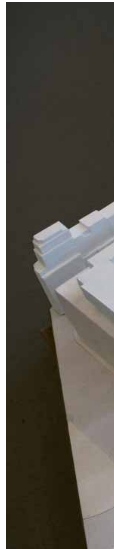
Gipsmodell av regerings- kvarteren

I januari 1986 började byggnadsarbetena i kvarteret Brunkhuvudet som innehåller flera intressanta byggnader. Huvuddelen av kvarteret bevarades och byggdes om, men 1600-talshusets tillbyggnader mot Jakobsgatan revs och ersattes med ett nytt hus. Hörnhuset Drottninggatan/Jakobsgatan är ett av de få kvarvarande från 1600-talets Norrmalmsreglering. Det uppfördes ursprungligen 1646 och 1652 av sadelmakaren Gudmund Dyk, men genomgick stora om- och tillbyggnader 1872 och 1916. Kontorshuset i hörnet Kardansmakargatan är ett av Stockholms första funkishus. Det byggdes 1928–29 efter ritningar av Wolter Gahn. Konsumbutikens som fanns i huset var under en tid Stockholms största snabbköp. Posthuset vid Malmtorgsgatan byggdes 1917–20 efter ritningar av Ernst Stenhammar. Åren