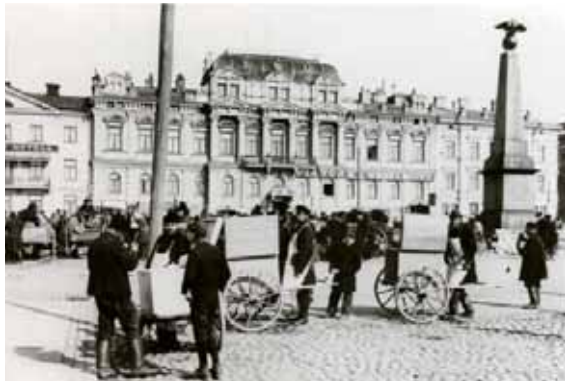
Det Tschernischeffska huset omkring sekelskiftet 1900.