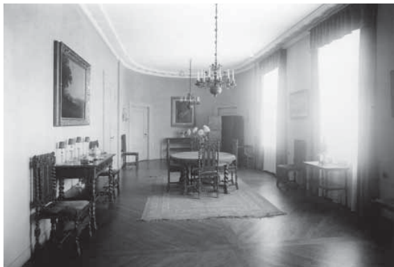
Den mindre matsalens inredning har förnyats under åren. Här en bild från 1920-talet.