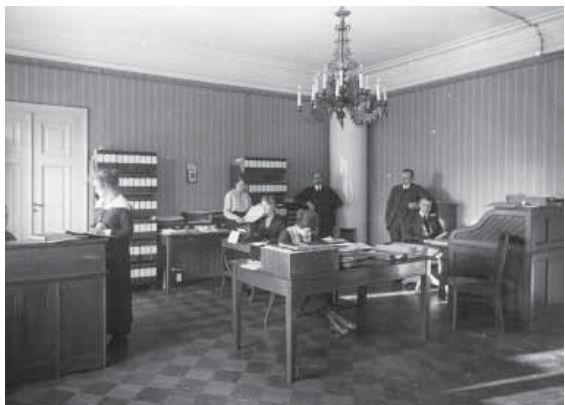
Det nyinredda ambassadkansliet på 1920-talet.

ktekten Torben Gruts utförande av och tankar om byggnaden, skapa nya kontorsutrymmen och förbättra standarden i bostäderna. Av åtta bostäder gjorde man tio. Per-Erik Ekman säger att bostäderna är trånga men det otroliga läget och husets charm gör att de boende accepterar det. I representationsvåningen förändrades ingenting utan salarna renoverades och man tog fram de färger Grut valt på 1920-talet. Det stora köket däremot fick en rejäl ansiktslyftning och för tillgänglighetens skull installerades en hiss upp till Vasagalleriets kapprum.