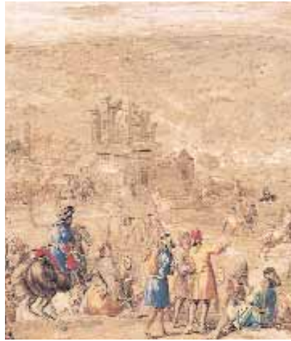
Det blodiga slaget vid Lund blev levande på väggen.

Så vilka är det som smyger omkring på våra slott och förvaltningsbyggnader under nätterna? Berättelser som de här ovan finns i olika varianter från hela landet. En förklaring kan vara människans uråldriga behov av att förstå och beskriva sin omvärld. I dag tar vi vetenskapen till hjälp när vi tolkar våra upplevelser. Men de som levde före upplysningens tid hade bara den personliga upplevelsen att luta sig mot. Tyckte man sig se en vit gestalt i slottsgemaket, då fanns det väl en vit gestalt i slottsgemaket. Detta synsätt förstärktes av att kyrkan på den tiden lyfte