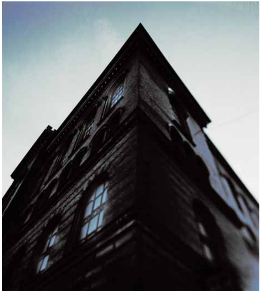
Är det munkar från gravarna under Birger Jarls Torg som är uppe och spökar i Riksarkivet?

Att det finns ett samband mellan den andliga dimensionen och storslagen arkitektur visar också författaren Dan Brown i sina uppmärksammade böcker Änglar och demoner och Da Vinci-koden . Marmor och gyllene bladguld utgör en fysisk bakgrund mot vilken de metafysiska dramerna spelas upp. Och vem vet – kanske är det här också förklaringen till vår Vita frun på slottet. Kontrasten mellan det andliga mjuka och det stramt storslagna är som skapt för en folklig såpa à la 1400-talet. KV