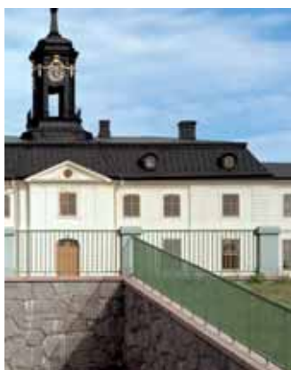
Den återuppförda rampen och den återställda fasaden.

De övriga sex blommönstren är rekonstruerade från förlagor, även om också dessa i praktiken är konstnärliga tolkningar. Därutöver finns två tapeterade rum som fått målade ramar i fältindelning.