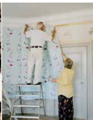
Montering av tapeter på trälistor.