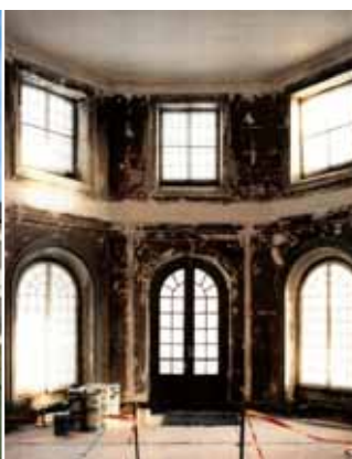
Salongen under restaureringsarbetet.