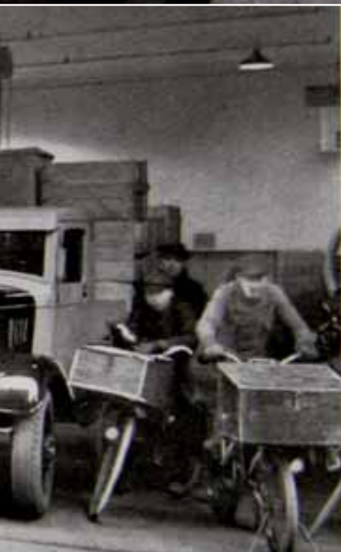
Från vänster till höger. De färdiga böckerna granskas och paketeras. Beställningskontoret. Dagens första omgång av fullastade bilar och cykelbud klara till start. Häftning med ståltråd i klammermaskin. Stentryckpressen där papperet mottager trycket direkt från den litografiska stenen.