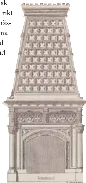
'Götisk spisel' ritad av Ernst Jacobsson för Rörstrand 1875.

priskuranten kallas 'Götisk spisel'. Jacobsen hade även ritat den kakelugn som stod i kronprinsparets matsal, och som enligt Herman Rings beskrivning var «starkt framspringande i rummet samt försedd med en öfverdel i form af en svagt sluttande stympad pyramid». Det stämmer bra med Rörstrands kakelugn. Den inre långväggen upptogs nästan helt av en vävd tapet, golvet täcktes av en röd matta och under matsalsbordet låg en lös matta. Rummets möblemang nyttillverkades i amerikansk valnöt och var rikt skulpterat i renässansstil. Stolarna var klädda med gulgrön pressad plysch.