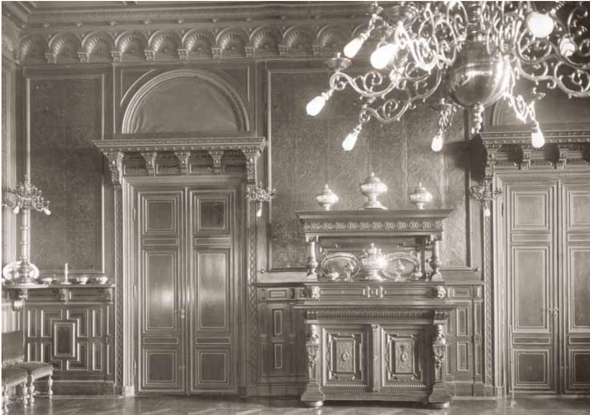
Kronprinsparet Gustav (v) och Viktorias matsal. Foto från 1890-talet.