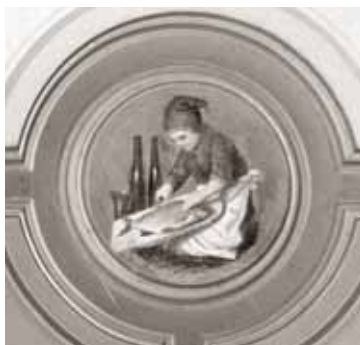
Detalj av en av takerundlarna med tomteflickor i hushållsbestyr.

i fest- och gästväningen. Rummen i de privata våningarna fick vänta. Restaureringen av Gustav v:s tidigare matsal blev det sista rummet som åtgärdades enligt de principer som fastställdes av Ivar Tengbom. Visserligen bevarades några av Fredrik Wilhelm Scholanders inredningar, men generellt uppfattades 1800-talets stilimitationer som smaklösa, överbelastade och ovärdiga i slottsmiljöer. Desto mer uppskattades nu 1700-talet, guldåldern för den svenska inredningskonsten och konsthantverket. Ovedersägligt uttalade man sig också utifrån en smakuppfattning som färgats av tjugotalssklassicismens ideal. 'Autenticiteten' blev också ett kvalitetsbegrepp. Begreppet har haft olika innebörd under olika tider och kan vara synonymt med 'original', men det kan också användas som klassificering av stil och utförande. Varför bevara stilimitationer när man i Slottet hittade de kvalitativt mest värdefulla inredningarna från 1700-talet? Många nedmonterade inredningar återfanns i slottsmagasinen. I praktiken blev det inte möjligt att vara stilhistoriskt konsekvent. Ivar Tengbom valde att åstadkomma en helhetsverkan där vissa estetiska kvaliteter lyftes fram.