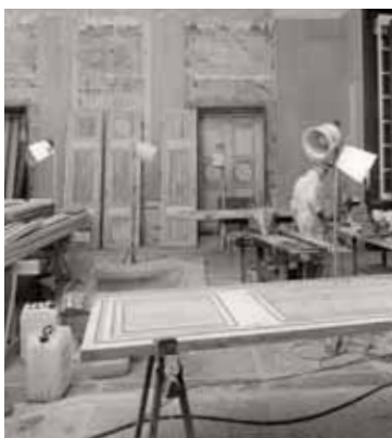
Restaureringen av prins Bertils matsal 1970–71.