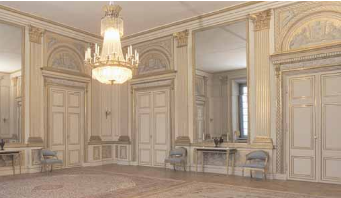
Prins Bertils representativa matsal efter restaureringen 1971.

som stått i rummen. När det inte var möjligt skapade man ett stilmässigt sammanhang av det som fanns till hands. Restaureringarna genomfördes i nära samarbete mellan slottsarkitekten och husgerådskammarens chef Åke Zetterwall, senare Stig Fogelmarck. I sin memoarbok Rum i tiden (1990) skriver Fogelmarck om den fascinerande verklighet som vården av «ett monument i Stockholms slotts höga klass innebär», och ger som exempel hur «Mårten Eskil Winges skink- och grötätande tomtar i taket i Gustav v:s mörka matsal fått ge vika för Louis Masreliéz ljusa, svala klassicism».