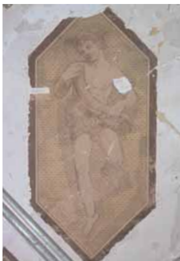
En av Winges gracer som hittades relativt välbehållen under 1970-talets övermålning.

Under 1920-talet restaurerades först Rikssalen, därefter Slottskyrkan och vissa trapphus och portaler. Principen var här att återställa miljöerna i enlighet med Tessins intentioner, och avlägsna tillägg som förvanskade autenticiteten. Tio år senare var det dags att åtgärda rummen. I en restaureringsplan upptogs sammanlagt tjugonio rum, huvudsakligen belägna