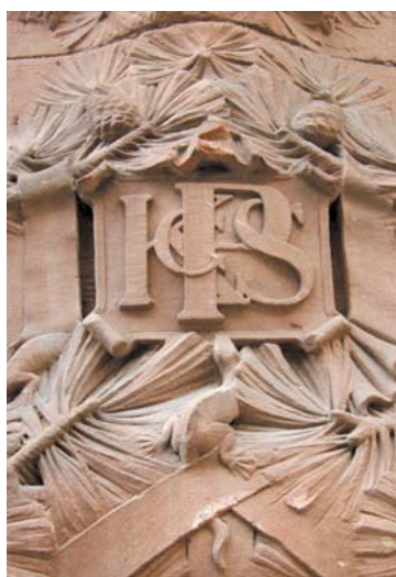
I fasadens växtornamentik finns insmugna smådjur tillsammans med Kungliga Generalpoststyrelsens monogram och symboler för postväsendet.

Socklarna utfördes i rödaktig granit från Vätö i Roslagen, medan de stora naturstenspartierna i gatufasaderna består av Övedsklosters sandsten. Till gatufasaderna tog Höganäs Stenkolsaktiebolag fram ett speciellt brunrött tegel, medan