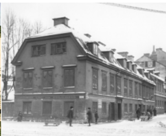
Kvarteret Riddaren med hörnhuset Vasagatan-Mäster Samuelsgatan 1895. Jämför vyn på sidan 23.

T.v. Ferdinand Bobergs tävlingsförslag från 1898.