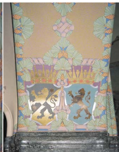
Interiörerna putsades och ornerades med tallkotts- och tallbarrsbårder blandade med postemblem, nations-, stads- och landskapsvapen. Dekorationsmålningarna utfördes av målarmästare J. Martin Eklunds verkstad.