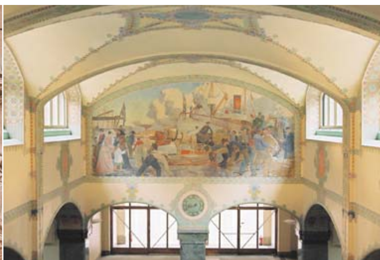
Carl Wilhelmssons stora fondmålning i centralposthallen visar en somardag på Skeppsbron med ett myller av människor. Målningen kom på plats 1907 efter en donation av Eva Bonnier.

T.v. I entrévalvets sandstensornamentik flyger brevduror över stadens byggnader in mot centralpostkontoret.