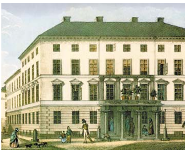
Posthuset vid Lilla Nygatan 6 rymmer i dag Postmuseet. Litografi från 1840-talet av Ferdinand Tollin.

I brandstationen syns tydliga drag av den amerikanske arkitekten Henry Hobson Richardsons formspråk. Under det slutande 1800-talet vaknade intresset för den amerikanska arkitekturen i Europa. Det var inte minst den stora utställningen i Chicago 1893, som ställde den transatlantiska byggnadskonsten i rampljuset. Ett tjugotal svenska arkitekter, bland dem Boberg, reste över med anledning av utställningen. Flera av dem hade också ambitioner att skaffa praktik vid något amerikanskt arkitektkontor och Boberg ska enligt uppgift ha praktiserat ett par må-