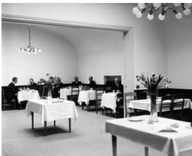
Första klassens lunchrum på andra våningen år 1917.

Elektrisk belysning installerades överallt och 2 322 glödlampor samt 54 båg-