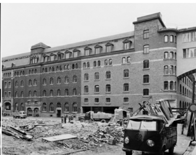
En bild från hösten 1960 har påpassligt fångat Centralposthusets hela fasad mot Mäster Samuelsgatan i samband med rivningen av grannkvarteret. Tillbyggnaden mot Klara Norra Kyrkogata från 1915 är utförd i enklare tegel men även den signerad Ferdinand Boberg.