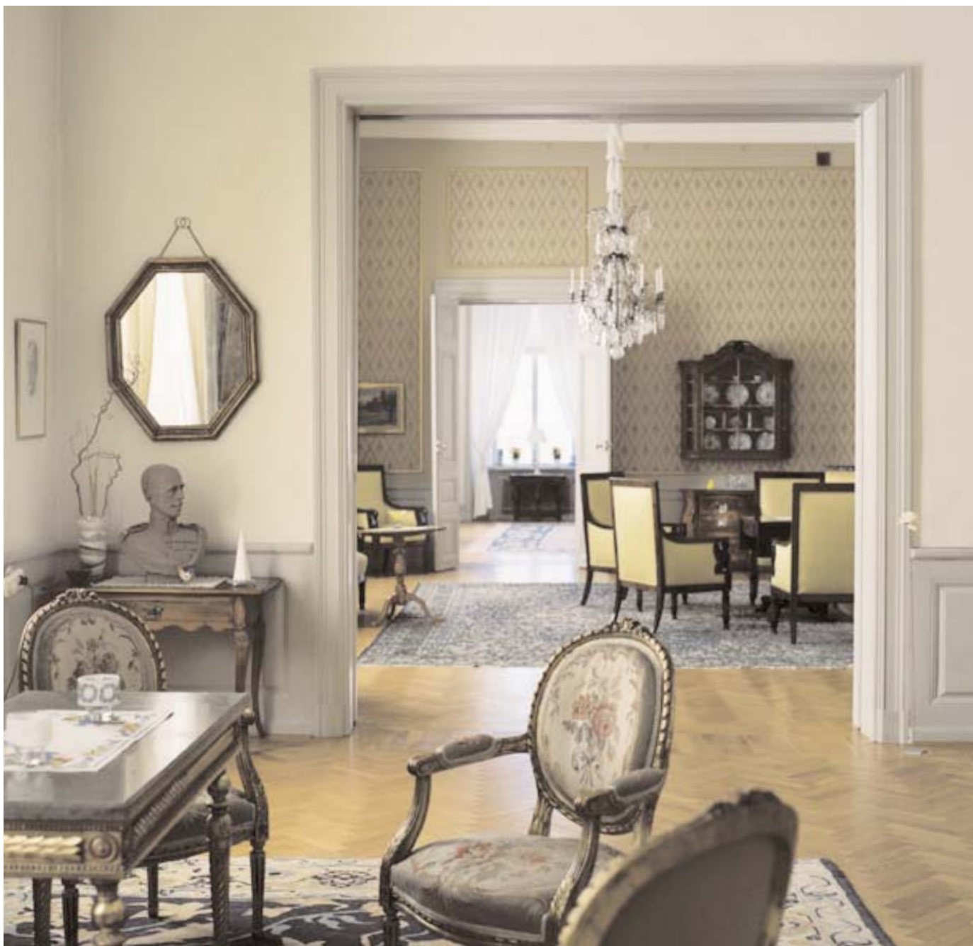
Lilla salongen tillskapades under slutet av 1700-talet vid en stor ombyggnad då landshövdingeresidenset flyttade in i slottet.