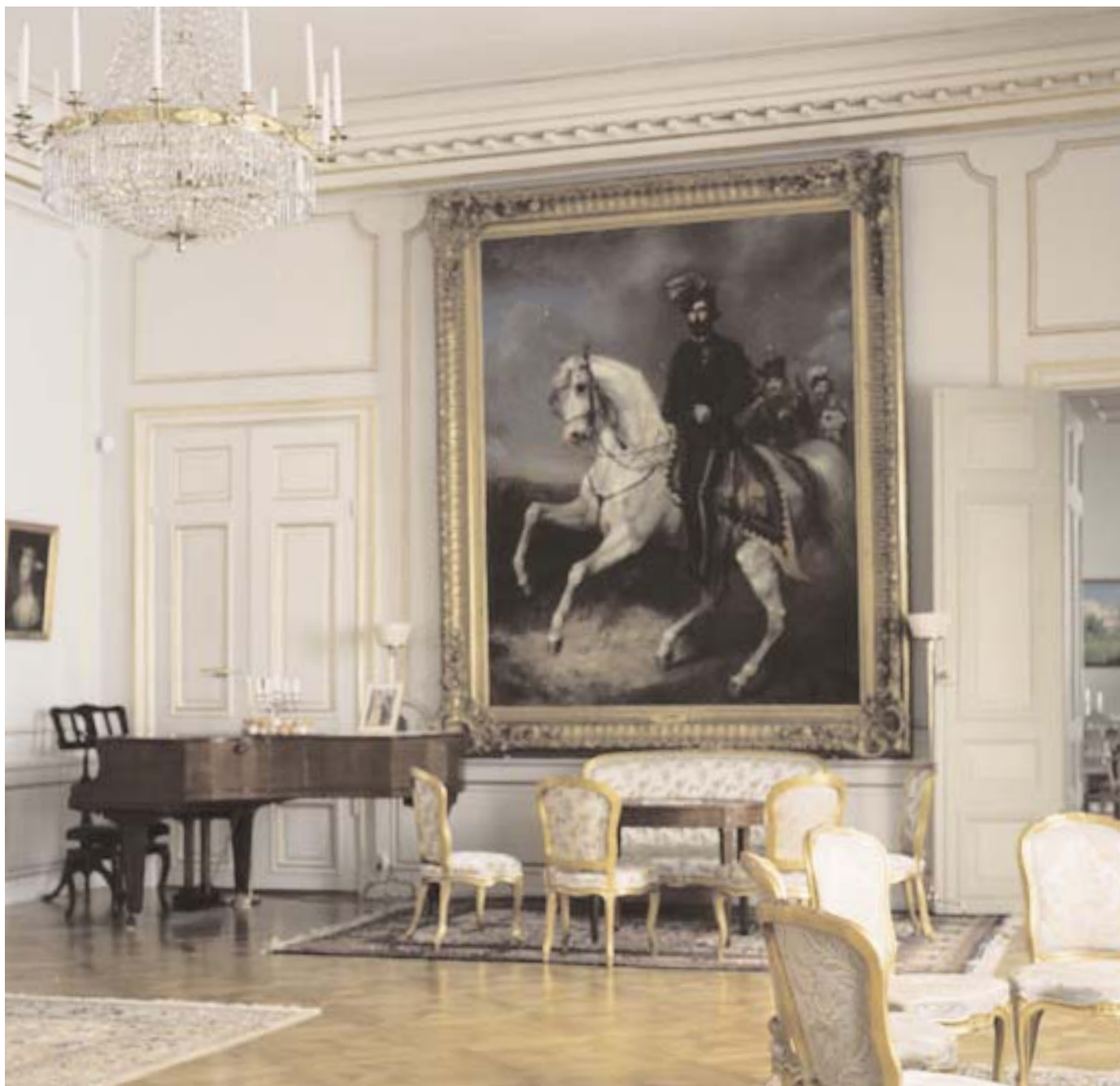
Restaureringen av Stora salongen är av antikvariska skäl kanske den mest intressanta, enligt slottsarkitekten Mats Fredriksson. Gråvit linoljefärg, förgyllda lister och ett praktfullt parkettgolv kännetecknar sekelskiftet 1900 med tidens intresse för den gustavianska stilen.