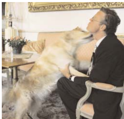
Tosca slickar glatt husse i favoritfåtöljen i Stora salongen.

– Vi ringer till varann här på slottet, det går inte att skrika, förklarar han.