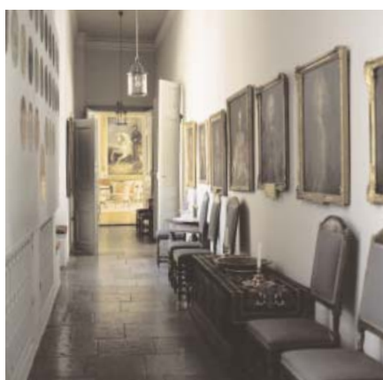
I Gallerigången hänger porträtten av Östergötlands landshövdingar som kungar på rad.

Om bara drygt ett år är familjen Erikssons epok på Linköpings slott över.