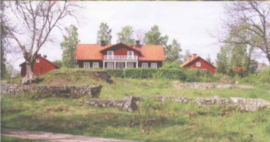
Ruinresterna sträcker sig med valvslagna rum in under kungsgårdens mangårdsbyggnad.