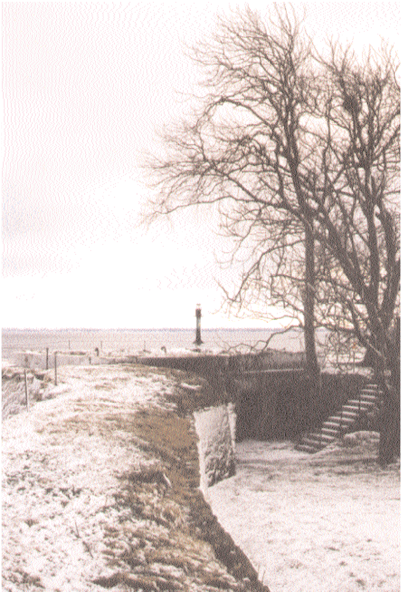
Från fästningsvallen ser man ut över den minimala borggården med Kalmarsund och Skansgrundets fyr i bakgrunden.