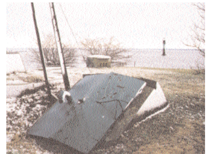
Den branta nedgången till minstationen döljs bakom två gröna järndörrar.

Tills för bara något decennium sedan var det här en viktig och ytterst hemlig del av det svenska försvaret. Minspärren vid Grimskär i södra Kalmarsund ingick i ett system av liknande spärstationer längs kusten som anlades under andra världskriget. Från skyddsvärn på land höll man uppsikt över strategiska passager eller kuststräckor där minor pla-