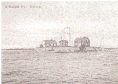
Från 1837 och ända in på 1940-talet fanns ett fyrtorn och en klunga byggnader för lots- och fyrpersonal på fästningsmurarna.

Sverige återfick Kalmar genom freden i Knäred 1613 och på 1620-talet var det dags för en ny kung att skriva till en ny ståthållare på Kalmar slott om nödvändigheten att befästa Grimskär. Om det berodde på den nye kungen, Gustav II Adolf, eller den nye ståthållaren, Herman Wrangel, är kanske osäkert men det