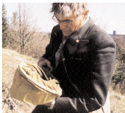
Högen rymmer inte bara intressanta växter. Även faunan är unik. En lycklig entomolog fann till exempel, i högens pepparrotsbestånd, en rar jordloppa som aldrig tidigare påträffats i Uppland.

besökare skulle sparas ut inne i åsens södra ände. Det var en stor volym som då inte kunde återfyllas och den ekonomiska intressegruppen ville kompensera sig med att i stället fylla på åsen på höjden. Det var slottsförvaltningen,