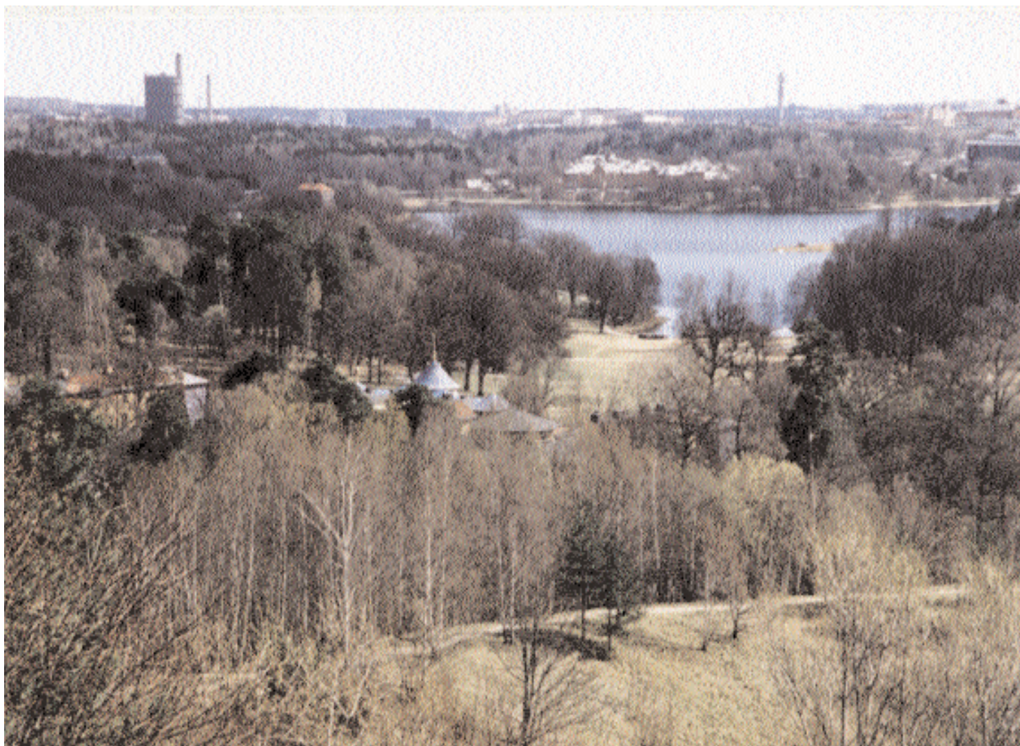
Från toppen har man en hänförande och milsvid utsikt över stora delar av Stockholm. Framför Koppartälten i bildens mitt sluttar Stora pelousen ner mot Brunnsviken. På horisonten till vänster ligger gasklockan i Hjorthagen med Lidingölandet i bakgrunden Till höger ser man Kaknästornet och Nacka.