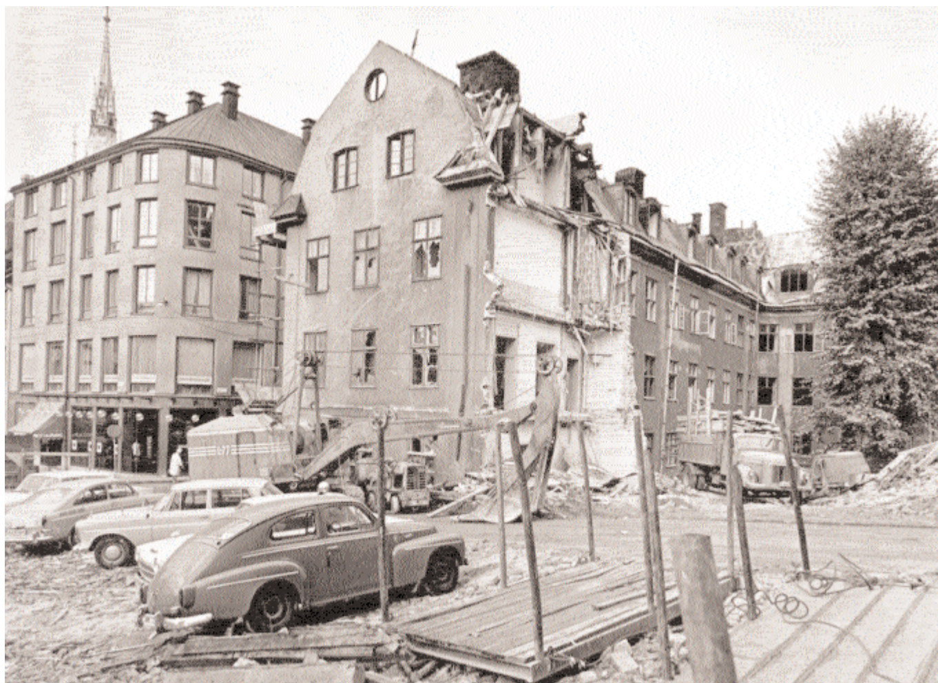
En del av kullen vid Haga består av rivningsmassor från skövlingen av Norrmalm på 1960-talet. Den mest anmärkningsvärda rivningen över huvud taget i samband med rivningsvägen inleddes i augusti 1968, då Preissiska huset på Drottninggatan 36 angreps av grävskoporna. Fastigheten var skyddad som statligt byggnadsminne fram till 1/7 1968, då ett markbytesavtal mellan staten och staden trädde i kraft och medgav att fastigheten fick rivas. Den äldsta delen visade sig vid rivningen ha ett målat bjälktak som kunde dateras till 1600-talets mitt.