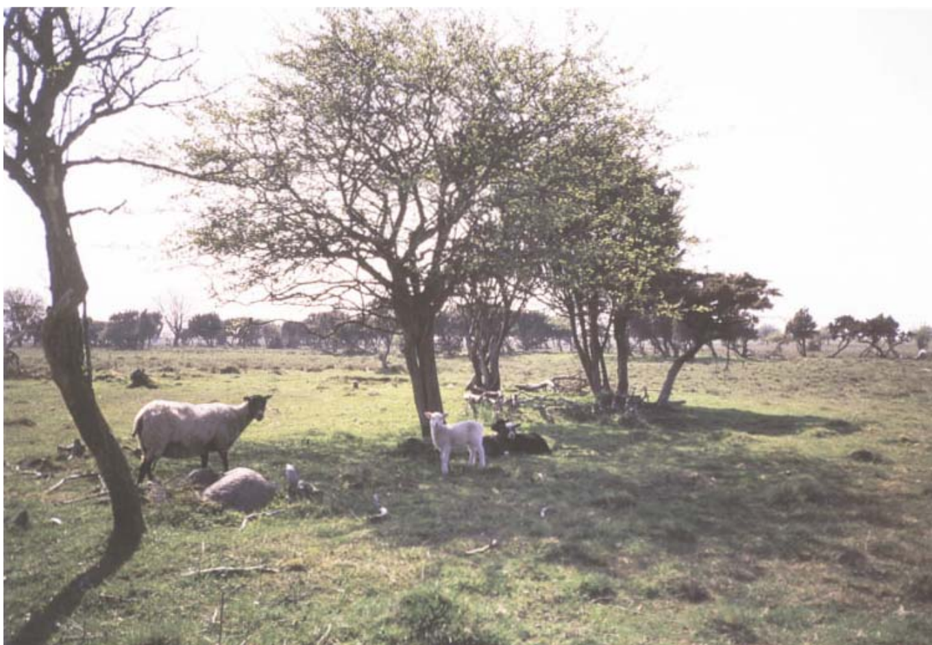
En grupp av Ottenbys 1000 får som håller markerna öppna söker skugga under södra Ölands buskträd.