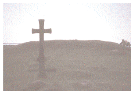
Ett kors minner om S:t Johannes kapell vid det gamla fiskeläget Kyrkhamn. Fyren Långe Jan byggdes av sten från ruinen.