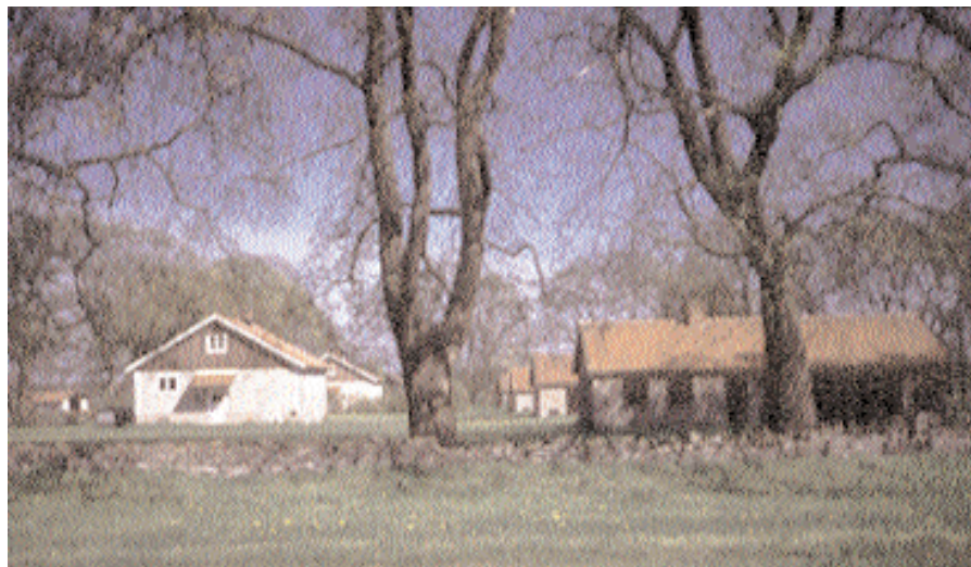
Några av kungsgårdens arbetarbostäder bakom rader av askar som planterats för att skona bebyggelsen från de pinande vindarna.