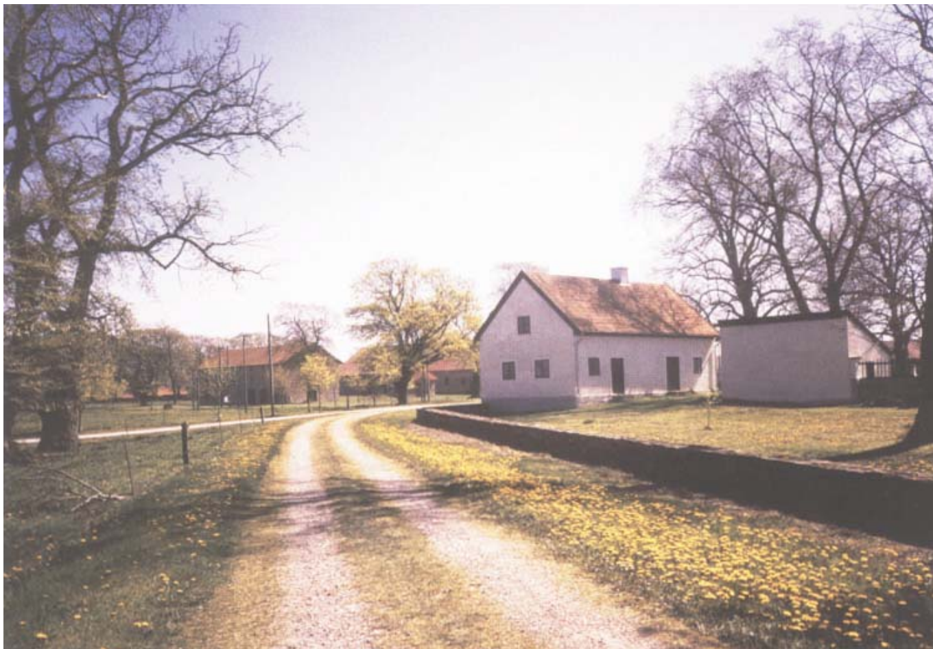
Till kungsgården hör en mängd olika byggnader. Det första som möter en då man följer gamla landsvägen upp mot gården är mejeriet.