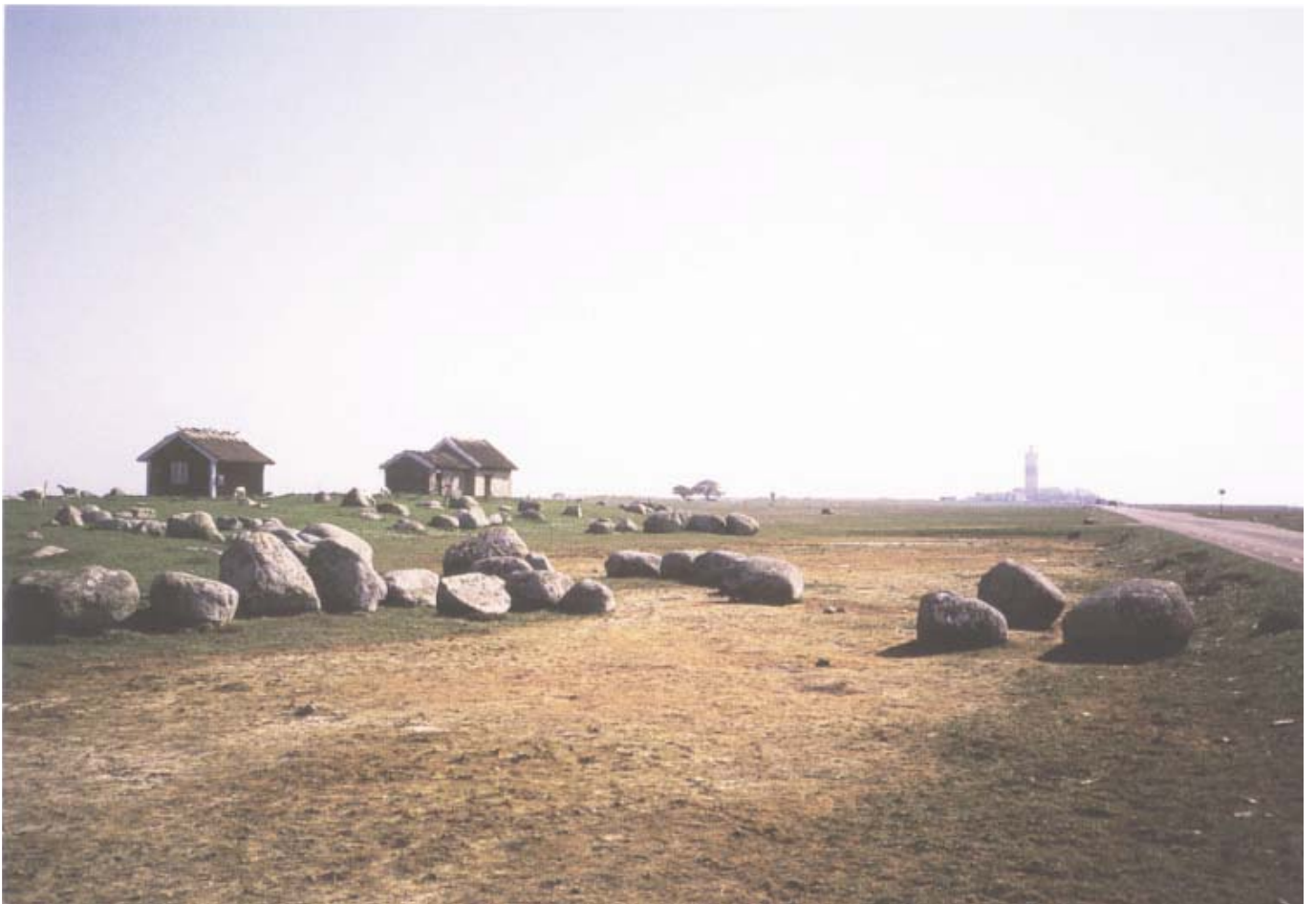
Fyren Långe Jan höjer sig över den flacka uddens fornlämningar och fiskarstugor och markerar inloppet till Kalmarsund. Innan fyren uppfördes 1785 var en mäktig hagtorn vid Rosenkinds källa länge sjöfararnas landmärke vid udden.

Johan III köpte in från England på 1570-talet till sin vid Ottenby anlagda jaktpark. En sådan sluten, från jordbruket avskild jaktmark, hörde till en europeisk furstes statussymboler.