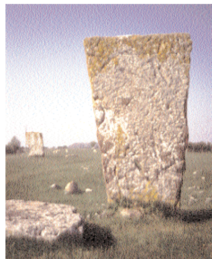
Kungsstenarna vid Ottenby. Enligt sägnen syftar namnet på de väldiga kalkstensflisorna på två kungar ur Ynglingaätten.

I Ottenby låg vid 1200-talets mitt flera mindre gårdar, men framför allt låg här ett viktigt fiskeläge med ett kapell helgat åt Johannes döparen. Fisket av sill, lax, ål och torsk var gott. «Till avhjälpande klostrets besvärande sillbrist» överlämnade biskop Henrik i Linköping enligt ett gåvobrev från år 1279 gårdar i Ottenby till klostret i Nydala. Arkeologiska utgrävningar av kapellruinen har daterat den till 1200-talet vilket stämmer bra med munkarnas ankomst, även om kapellet enligt traditionen skulle varit uppfört av fiskarna. Under kapellet har man funnit spår av bebyggelse som kan dateras till sen