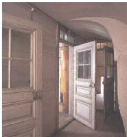
Den så kallade Hönshimlen är en låg mellanvåning, mellan övre våningen och vinden, som innehöll bostäder för tjänstefolk.