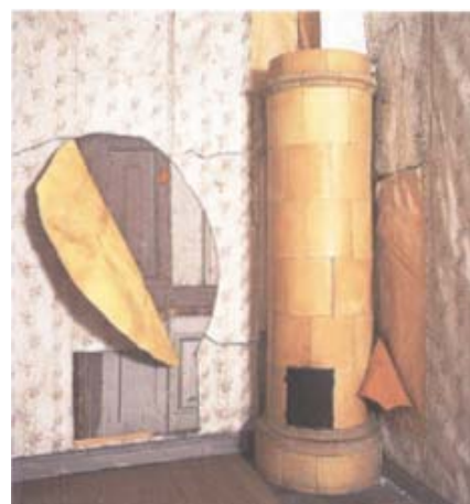
Kabinett inmanför stora sängkammaren.