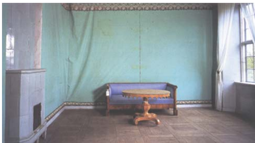
Sovrum invid kapellet på övre våningen.