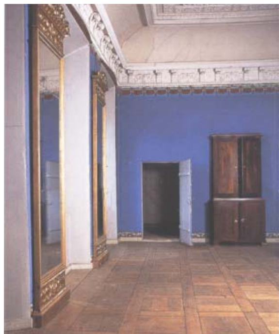
Stora sängkammaren på övre våningen med stucktak från omkring 1700.