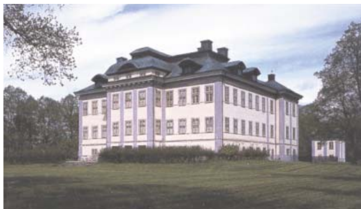
Slottet mot söder.