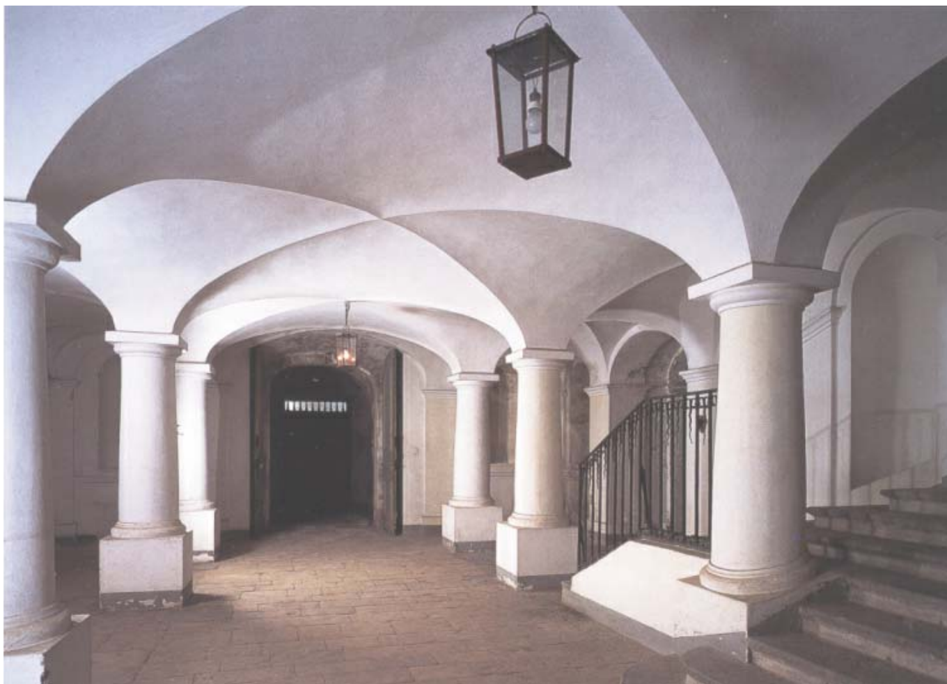
Pelarfärstun delar husets markväning, som inrymde ekonomilokaler och bostäder för tjänstefolket.

lingen med nådevedermälen, men inte desto mindre blev Magnus Fredrik i likhet med många av sina ståndsbröder med tiden mycket kritisk till konungen och hans maktutövning.