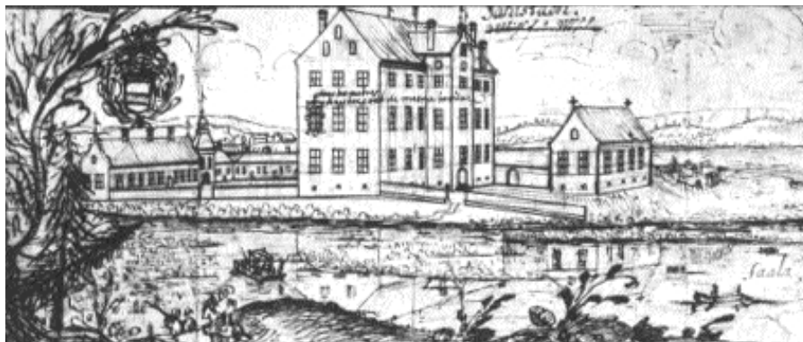
Omkring 1610 lät Nils Bielke uppföra en ny huvudbyggnad på Salsta, en ståtlig renässansbyggnad vars murar ingår i det nuvarande slottet. Teckning av Erik Dahlberg, från 1660-talet för Suecia Antiqua et Hodierna .

Det har dryftats vem som är arkitekt till det nya Salsta och Nicodemus Tessin den äldres namn har nämnts i olika