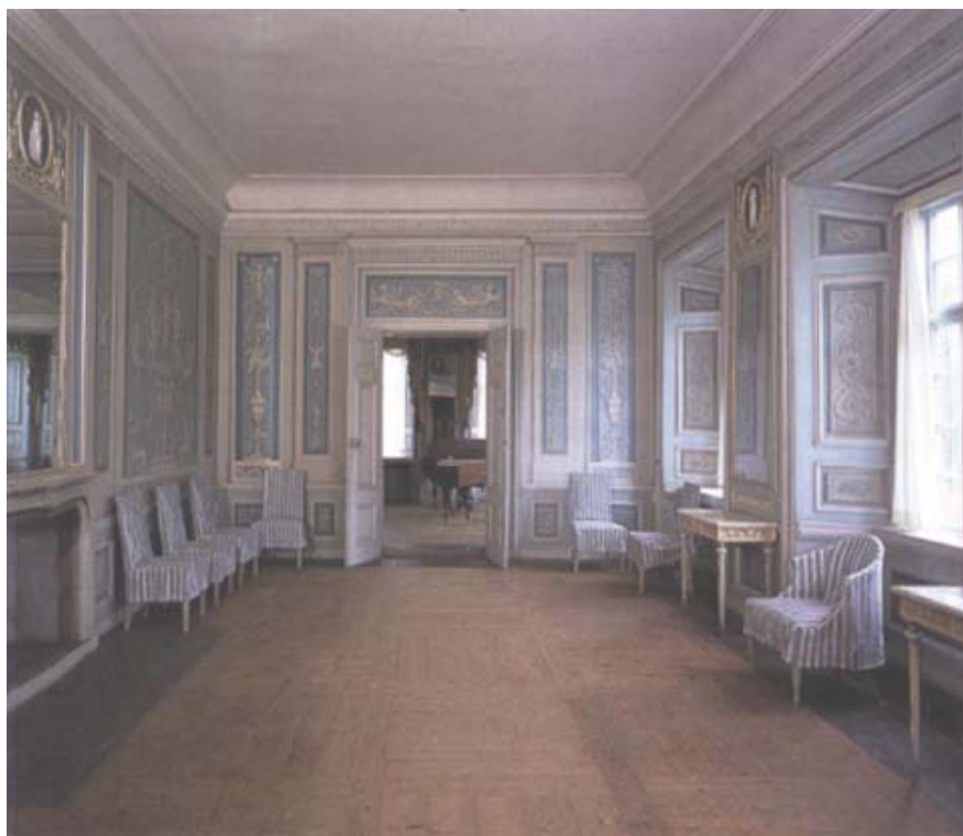
Blå salongen på huvudvåningen mot musikrummet. Blå salongen inreddes i slutet av 1700-talet i sengustaviansk stil i det manér som brukar förknippas med epokens ledande inredare – Louis Masreliez.