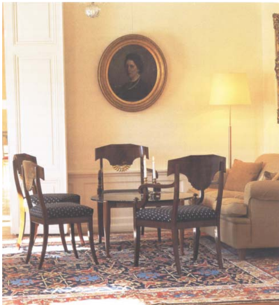
Över: En av salongerna har möblerats med moderna möbler och Karl Johan-stolar i mahogny.

På 1860-talet behövde länsstyrelsen större lokaler och man köpte då grannhuset, Westbergska gården. Det fanns