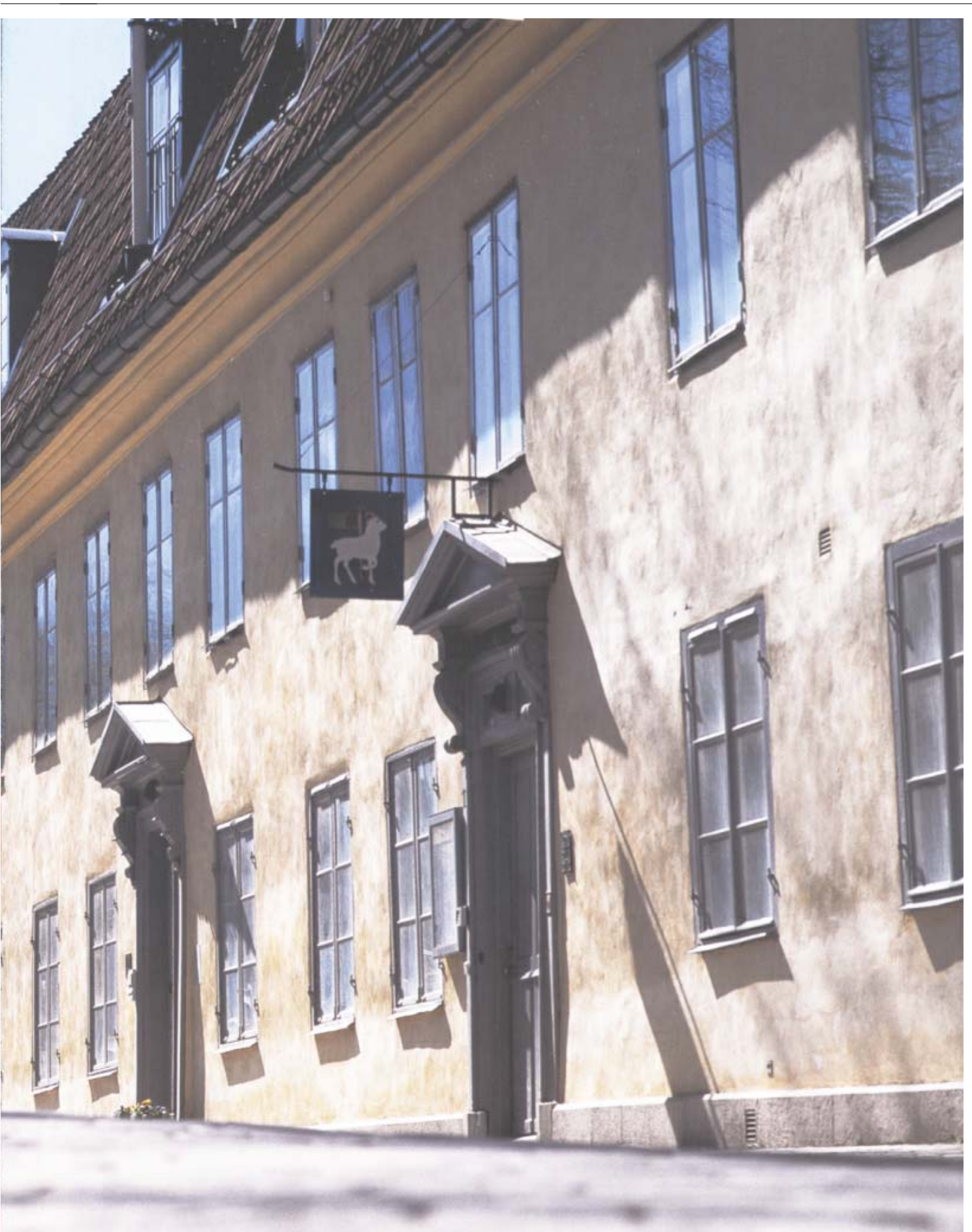
Länsresidenset är inrymt i en relativt anspråklös byggnad från 1700-talets andra hälft. Huset, som ligger vid Strandgatan i Visby, förvärvades av Kronan 1822.