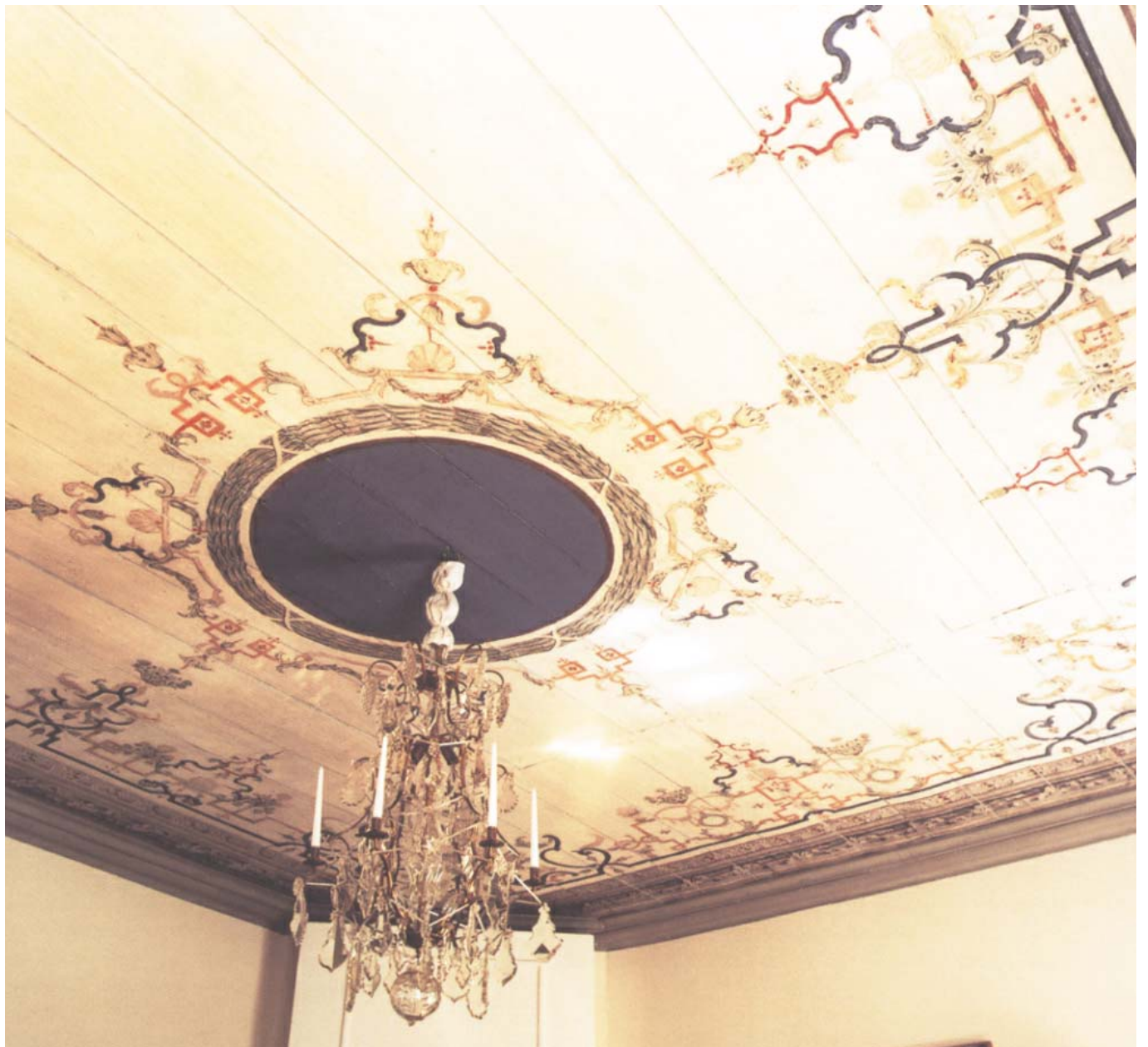
Det dekorerade 1700-talstaket togs fram och renoverades på 1950-talet.