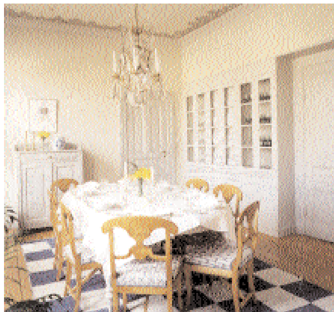
Den forna privatmatsalen.