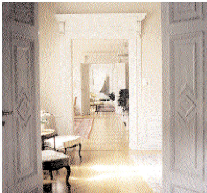
Från stora bankettsalen på övervåningen ser man genom övre hallen och salongen mot kabinettet.

Inför Fabian De Geers tillträde som landshövding 1906 gjordes en grundlig renovering av residenset under ledning av Torben Grut, Stockholms stadions arkitekt, som själv var bördig från Skaraborg. Bland annat skapades då entréhallen samt den nuvarande stora matsalen på bottenvåningen genom sammanslagning av tre mindre rum. De Geer efterträddes 1917 av direktö-