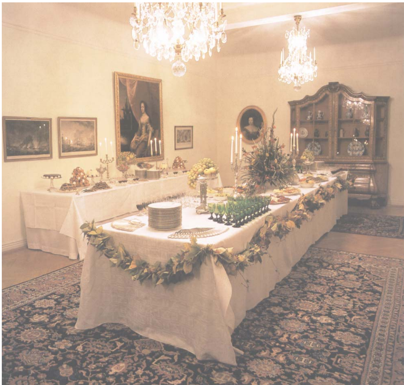
Stora matsalen på bottenvåningen.

ren för Finspångs styckebruk Axel Ekman och även vid detta landshövdingeskifte gjordes betydande ombyggnader och reparationer i residenset. Samtidigt flyttade Vadsbo museum till residensholmen.