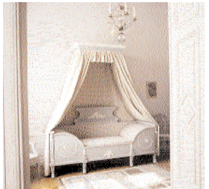
Kabinettet på övre våningen.