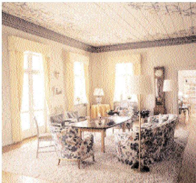
Trädgårdssalongen, ursprungligen sal i den mangårdsbyggnad som uppfördes 1733.