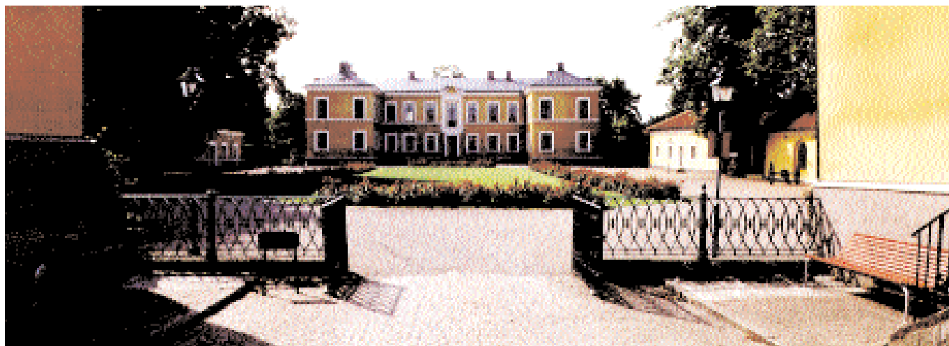
Huvudbyggnaden och trädgården från entrén mellan kansliflyglarna. Till vänster ligger den tidigare betjäntflygeln och till höger köksflygeln.

Inte heller Örneklous skapelse hade någon större framgång i kampen mot tidens gnagande tand. Den närmast notoriska vanvård Kronan bestod sina hus i landsorten föranledde landshövding Soops hustru att i mars 1708 skriva i ett brev: «Vi äro rät komna till ett