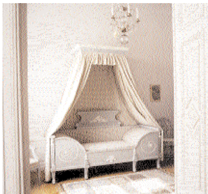
Kabinettet på övre våningen.