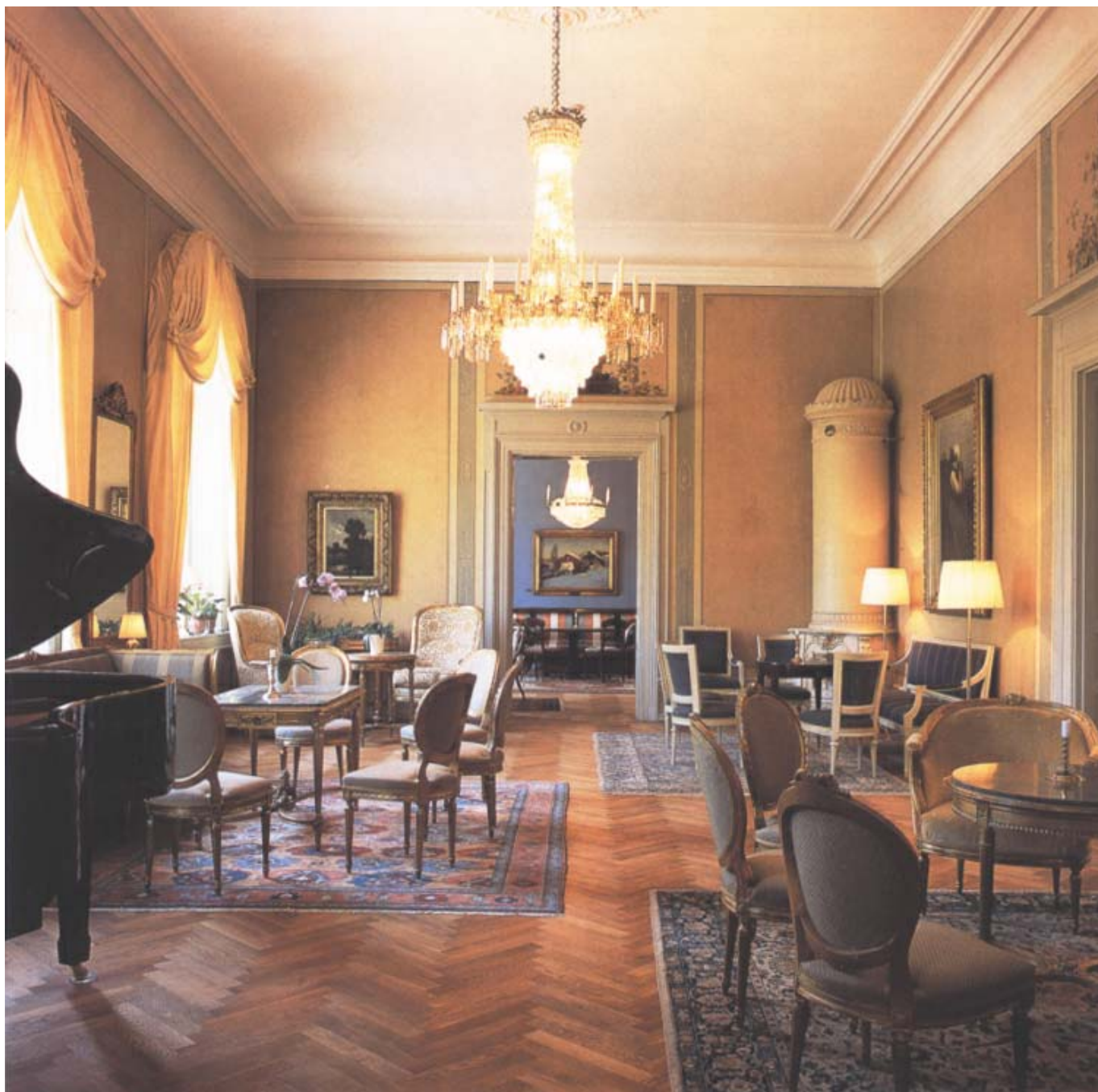
Gula salongen med möbelgrupper i gustaviansk stil är, tillsammans med matsalen, residensets största rum. Här finns husets två bevarade 1800-talskakelugnar.

No 3 B) metod eller och af zink. Modellerna till dekorationerna öfver medelpartiet skola göras af en skicklig bildhuggare och gillas af Kongl. Öfver Intendents Embetet uti alla rum, som ritningen utvisar, uppsättas tillräckligt stora hvitglacerade kakelugnar af bästa sort; i Embetsrummen med starka polerade luckor och smidesramar, spjelledare, sotluckor och ventiler; i Landshövdingens våning med luckor, spjelledare, sotluckor och ventiler är messing samt innanluckor af tjock jernplåt i starka smidda ramar. Glaset i fönstren skall vara plant och helhvitt utan fläckar, repor och blåsor, tjockare