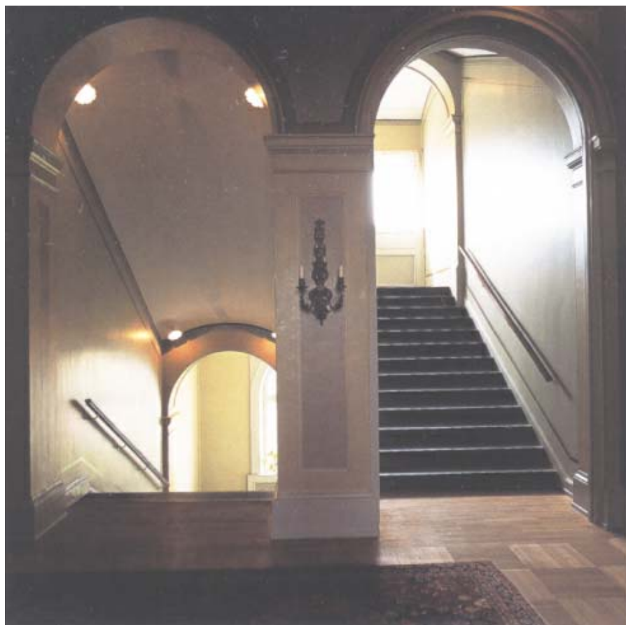
Trapphuset har målats på nytt med linoljefärg till det utseende det hade då huset var nybyggt.

Trappan mynnar i en hall eller tambour, som den kallas på ursprungsritningarna. Här har senare färglager avlägsnats och originalmålningen från 1886 tagits fram. Från tamburen kommer man in i Stora eller Gula salongen som är representationsvåningens förnämsta rum och närmare 70 kvadratmeter stort. Det vetter med tre stora rundbågiga fönster mot Skolgatan och Rådhusparken. Ovanför dörrarna finns målade överstycken med blomstermotiv som utfördes 1926, och sannolikt fick väggarna samtidigt sin 1700-talsinspirerade utformning. Ursprungligen var de tapetserade och taket, som nu är vitt, var dekorerat i färg efter tidens manér. I salongen finns två kakelugnar från byggnadstiden – för övrigt de enda som är bevarade i huset. Rummet är möblerat i gustaviansk stil med flera möbelgrupper. Den stora kristallkronan, som hänger i en rikt dekorerad takrosett från byggnadstiden, är från mitten av 1800-talet. I salongen finns