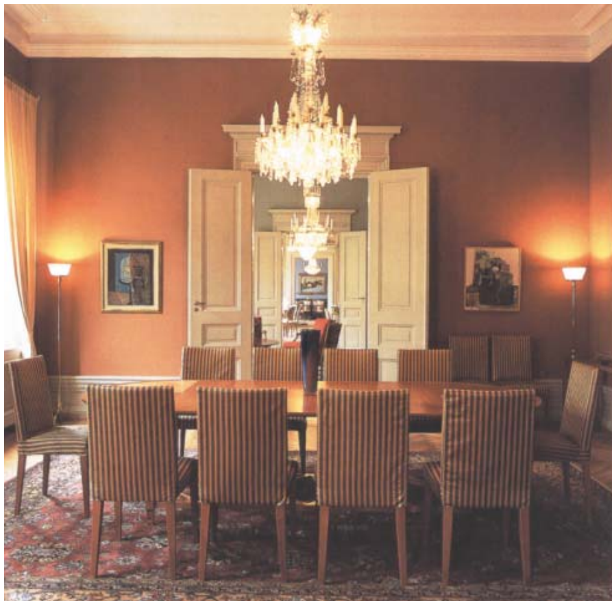
Lilla matsalen, som från början var sängkammare, har inretts med tegelröda väggar och moderna möbler.