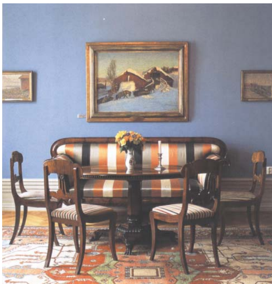
Innanför Gula salongen ligger Blå salongen, tidigare förmaket, som har möblerats i Karl Johansstil.