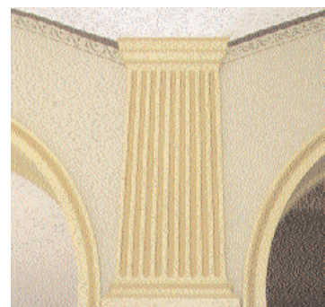
De dekorativa interiördetaljerna har återställts vid renoveringen.

en, de båda förmaken och sängkammaren tak och takrosetter som var dekorerade i färg.