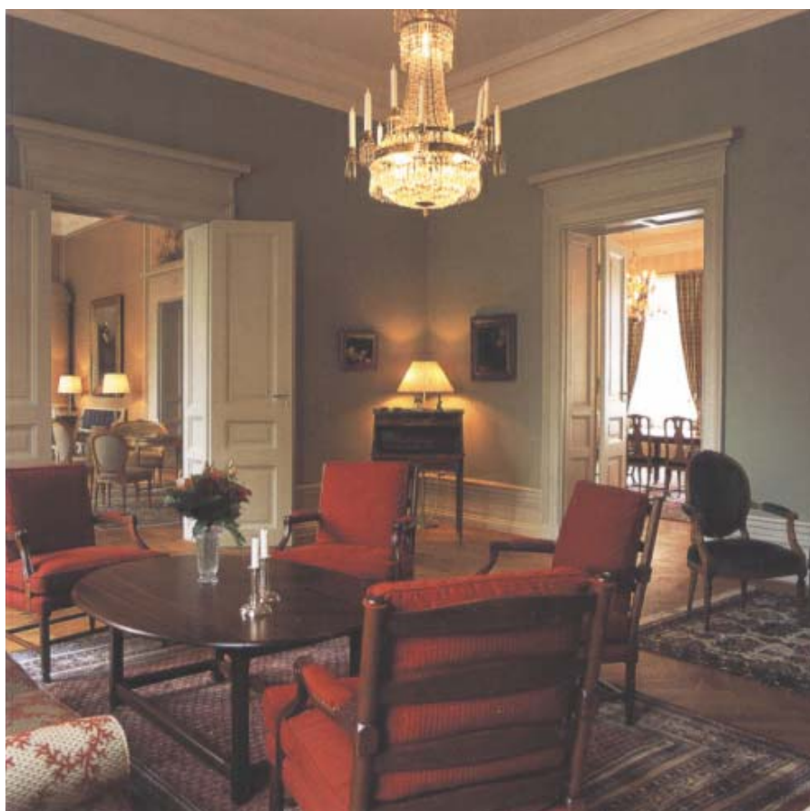
Gröna salongen, med utblickar mot Gula salongen och matsalen, var ursprungligen ett förmak och fick sitt nuvarande utseende vid senaste restaureringen.