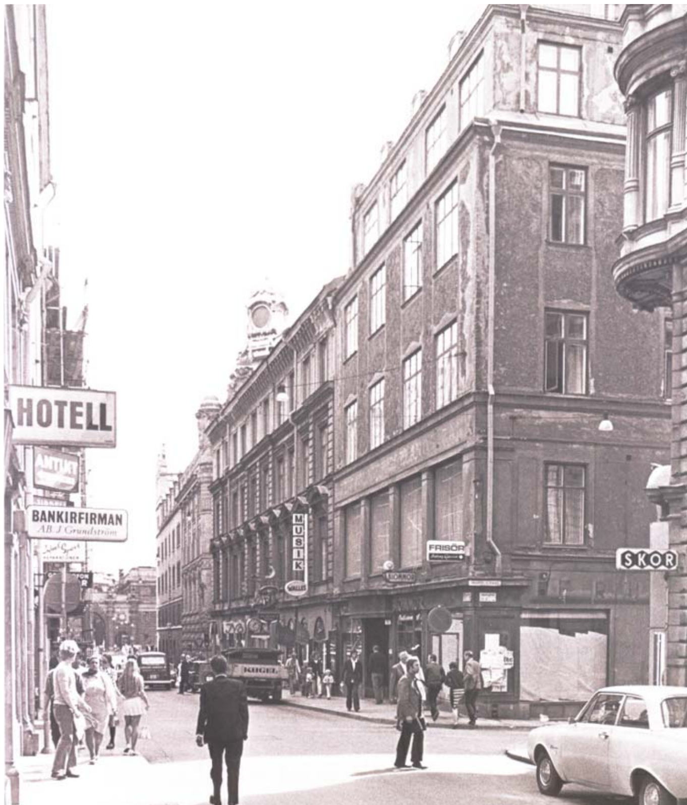
Kvarteret Tigern sett från hörnet Jakobsgatan/Drottninggatan 1971. Huset närmast till vänster uppfördes vid mitten av 1600-talet. Det skadades i Klarabranden 1751 men kunde repareras. På 1910-talet byggdes det om till kontorshus för Gotlands Bank. Huset revs 1978.