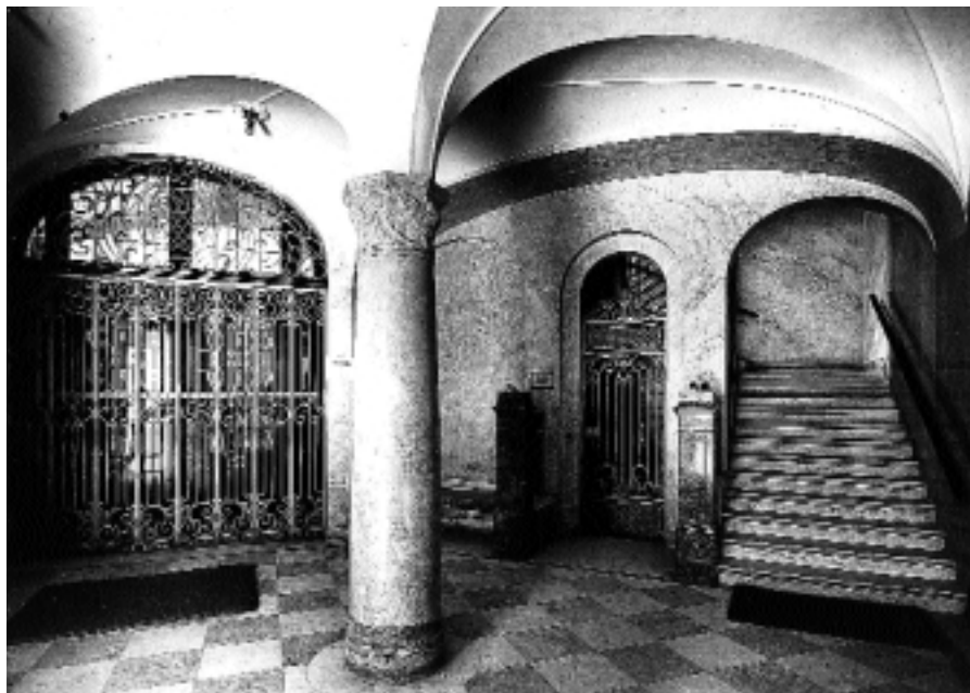
Norrlandsbankens entréhall 1904. Till vänster bakom gallergrinden är ingången till bankhallen.

Vanja Knocke, arkitekt SAR; Wingårdhs Arkitektkontor AB Roland Persson, projektledare; Statens fastighetsverk