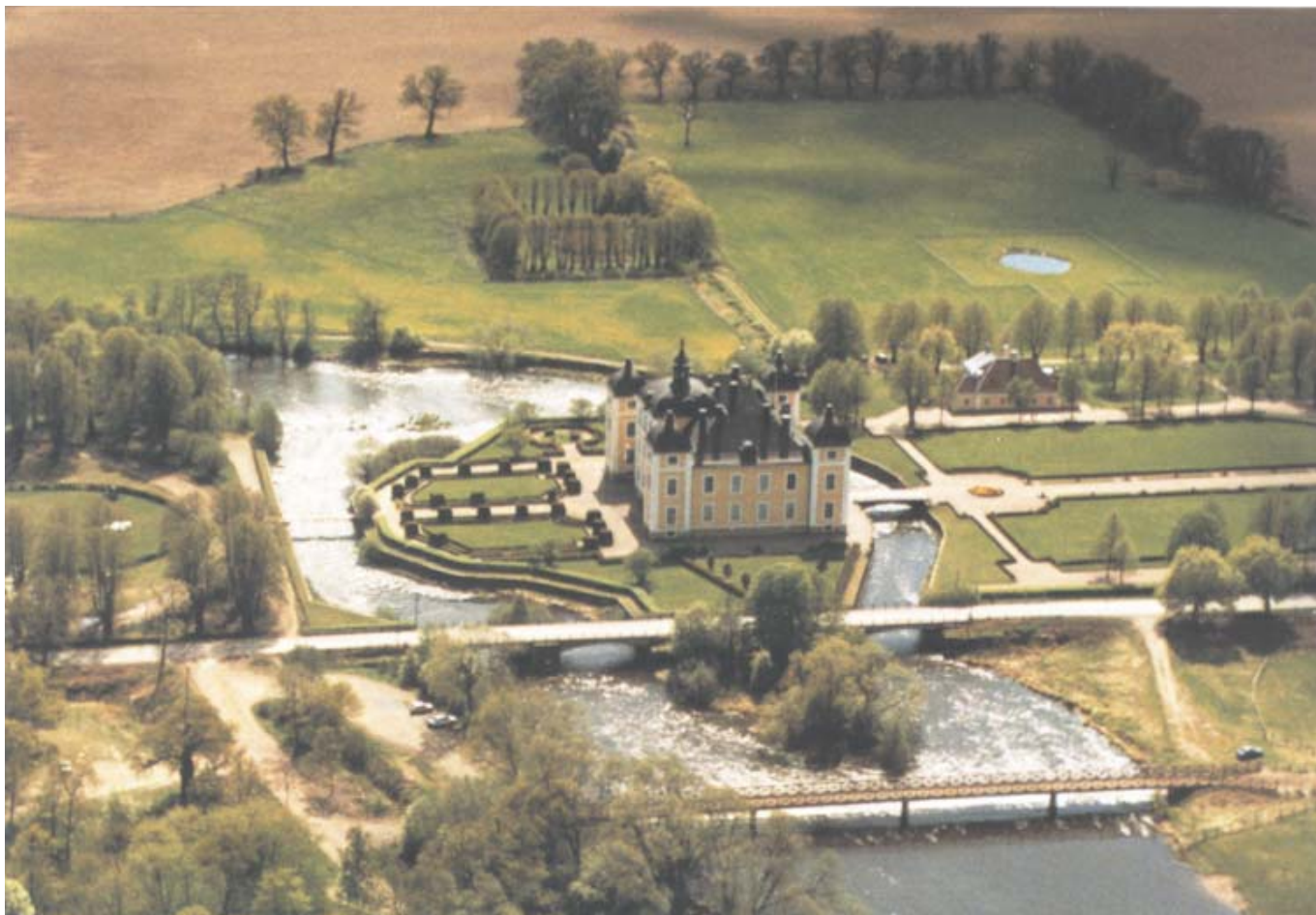
Strömsholms gula barockslott på sin holme i Kolbäckån, omgivet av den restaurerade Hårlemananläggningen i 1900-talstappning.