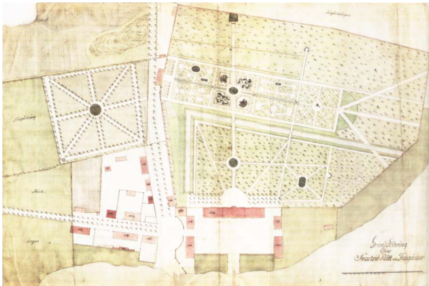
Grundritning över Svartsjö slott från 1771.

ra att man ansåg att de skymde slottet. Trädgårdsarkitekt Walter Bauer gjorde i samråd med slottsarkitekten ett förslag till en radikal beskärning som utfördes 1979. Detta gav tujorna ett fyrkantigt utseende som hade föga gemensamt med 1700-talets barockanläggningar. Beskärningen var hård för de uppvuxna, rätt grova tujorna och efter flera kalla vintrar under början av 1990-talet dog cirka hälften. På 1900-talsparterren framför slottet genomförde Fastighetsverket därför en restaurering och en förnyelse under 1994 och 1998.