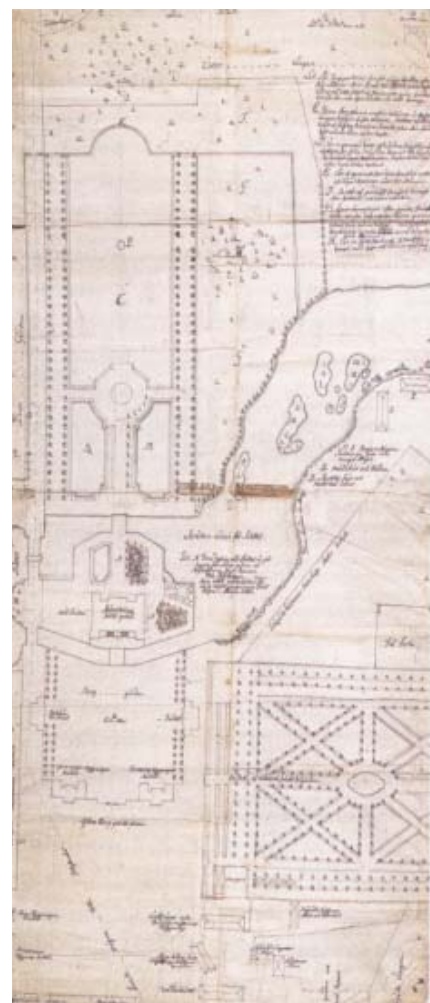
En avritning av trädgårdarna vid Strömsholm omkring 1750, Riksarkivet. Här ser man Tessin d.y:s samt Carl Hårlemans utförda förändringar i utformningen av parterrerna i lustträdgården samt Hårlemans förslag till utformning av trädgårdsanläggningen på slottsholmen.