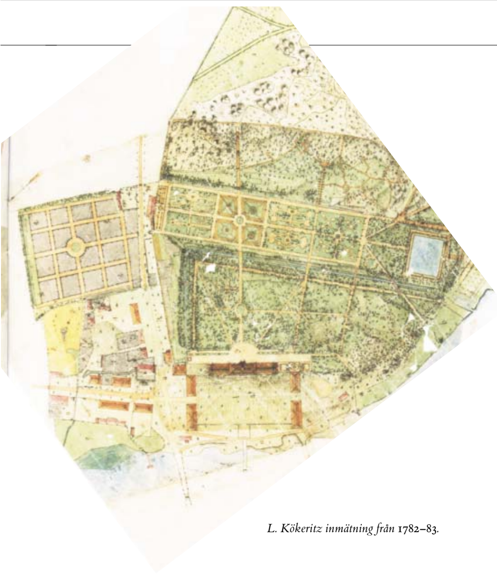
L. Kökeritz inmätning från 1782–83.