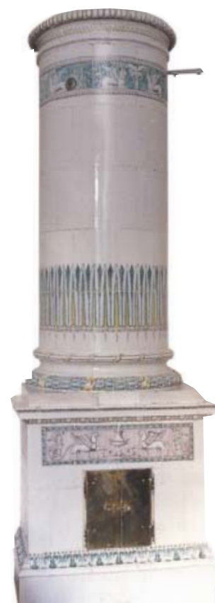
Kakelugn från tiden omkring 1800. I residenset finns ett antal ugnar från denna tid, flyttade från någon äldre byggnad i staden. Kanske har de stått i 'Prinshuset', residensets företrädare på tomten.