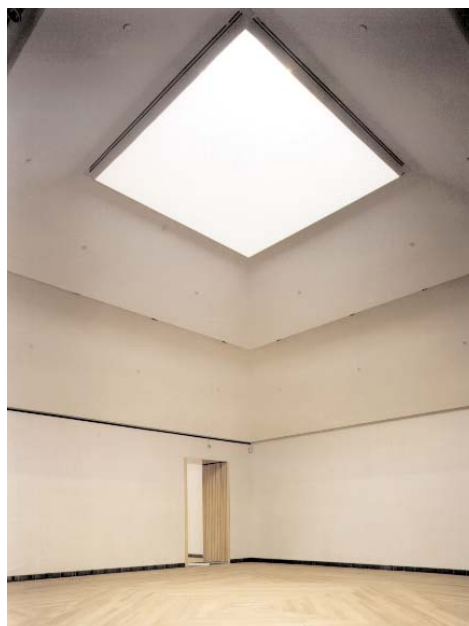
De rymliga utställningssalarna för den permanenta samlingen har alla kvadratisk planform och får sitt överljus från takets lanterniner. Ett elektroniskt reglerat ljusinsläpp bidrar till en jämn belysning året om.