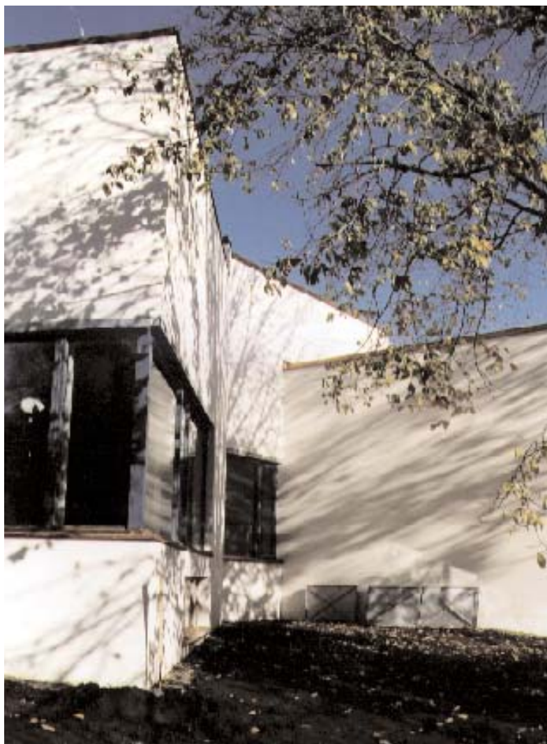
Hommage à skandinavisk modernism. Den nya administrationsbyggnaden för Arkitekturmuseet har ritats av Rafael Moneo och är förbunden med det gamla exercishuset genom en glasad gång.