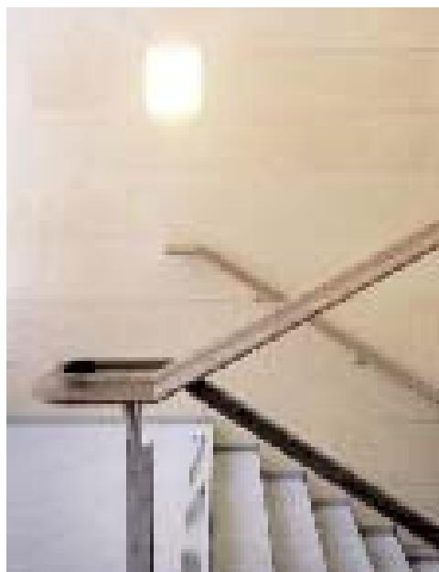
En sofistikerad enkelhet. En vacker kalkstens-trappa förbinder Moderna museets huvudvåning med de undre våningsplanen.

För tävlingsjuryn vidtog nu ett krävande och tidsödande arbete att granska de olika tävlingsförslagen och när det till slut bara återstod ett – det vinnande 'Telemachos' – var gissningarna