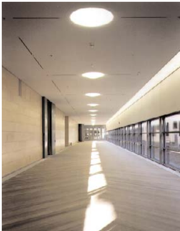
Ett långt glasat galleri förbinder Moderna museet med Arkitekturmuseet i det gamla exercishuset. Nordiskt 'blonda' material som ek, björk och gotländsk kalksten sätter sin prägel på interiörerna.