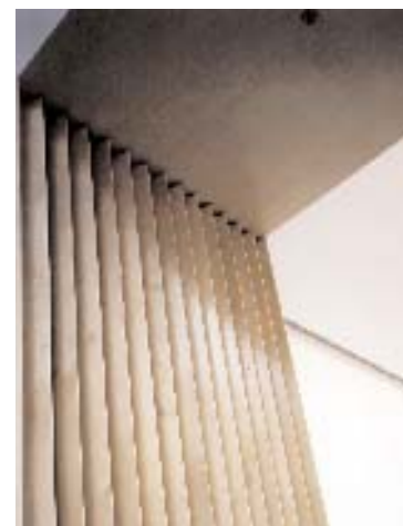
Raffinerade passager från rum till rum. Omsorgsfullt utformade detaljer, som utställningssalarnas 'veckade' björkpanel, bidrar på ett effektfullt sätt till att bryta interiörernas strama geometri.