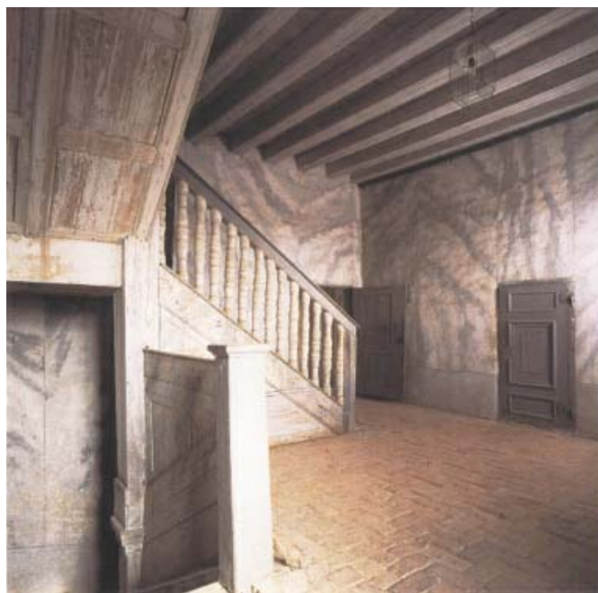
Det översta trappplanet har också bevarat sitt 1600-talsutseende.