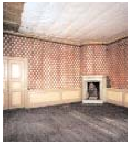
Då det gamla slottet nyrinreddes på 1800-talet dekorerades rummen med tapeter och målningar i tidens smak. Paradsängkammaren, Blå gästrummet och Röda salongen fick sina snickerier och kakelugnar från 1700-talet övermålade i 'modernare' mönster och färgställningar.