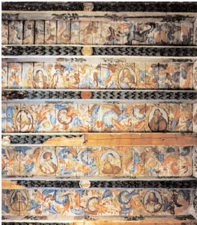
I Bogesunds slott finns flera målade bjälktak från tiden omkring 1650. I den nys avslutade restaureringen har delar av träbjälklagen bytts ut utan att ytskikten skadats.

samtidigt byttes alla fönster ut. Dessutom åtgärdades taken och parken restaurerades.