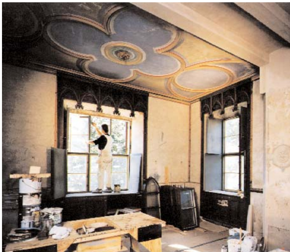
Vid ombyggnaden av Bogesund på 1860-talet inreddes en matsal i nygotisk stil. Under slottets period av förfall skadades rummet svårt och bland annat störtade delar av taket in. Rummet restaureras nu till sitt ursprungliga utseende.

Bogesund beboddes endast under sommarhalvåret eftersom familjen i likhet med andra välbärgade medlem-