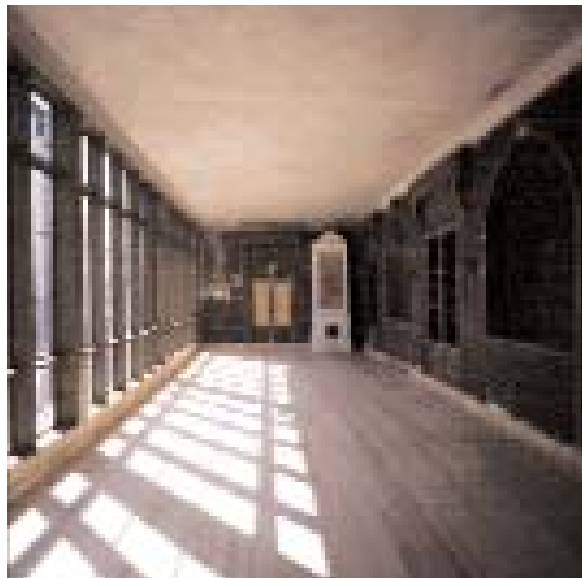
Vid ombyggnaden av slottet på 1860-talet tillkom en vinterträdgård, som blev illa skadad under den tid Bogesund stod övergivet. Under den pågående renoveringen har vinterträdgården återställts.