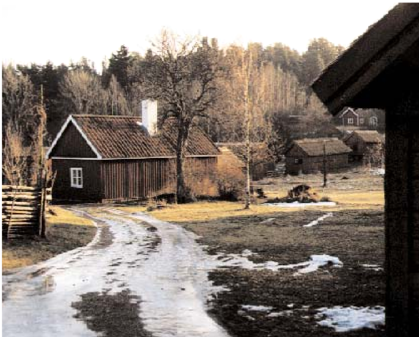
Viby visar på ett ålderdomligt ekonomiskt nyttjande av marken, där husen är spridda över backar och berg som inte lämpade sig för odling.

minnesmärke och samtidigt upphörde dagsverksskyldigheten vid Venngarns slott för Vibytorparna.