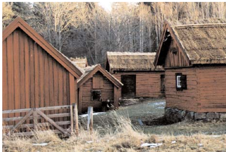
Under 1800-talet förändrades gårdsstrukturen i allmänhet mot allt fler funktioner under samma tak. Gytter av små hus som i Viby, där varje hus är byggt för sin funktion, blev allt ovanligare.