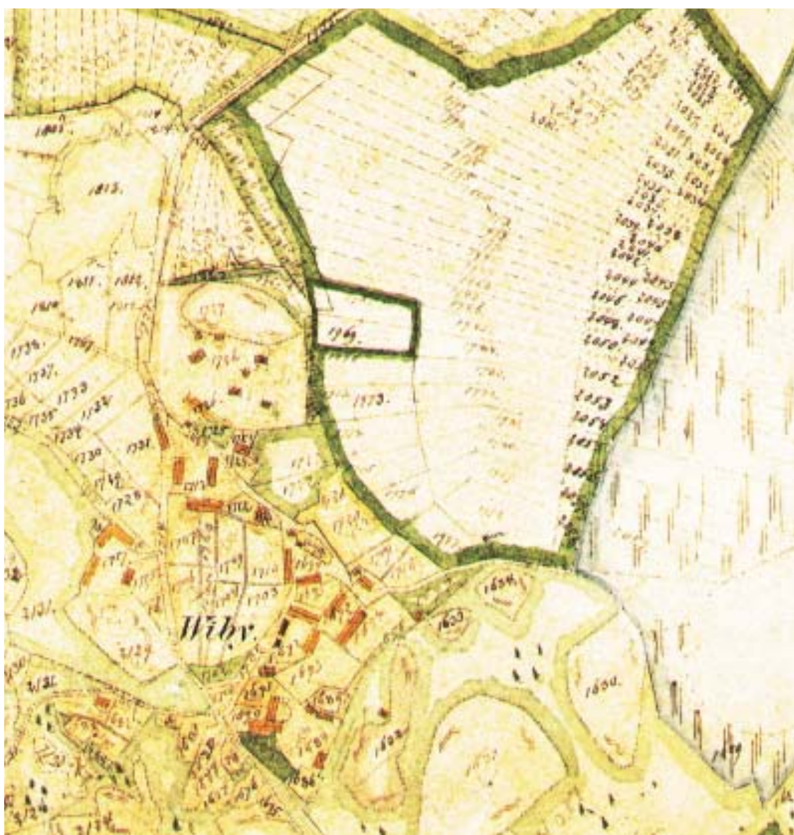
Arealmätning från 1868, som visar hur jorden fördelades mellan gårdarna. Ner mot Garnsviken är slätterrällen uppdelad i smala tegar.