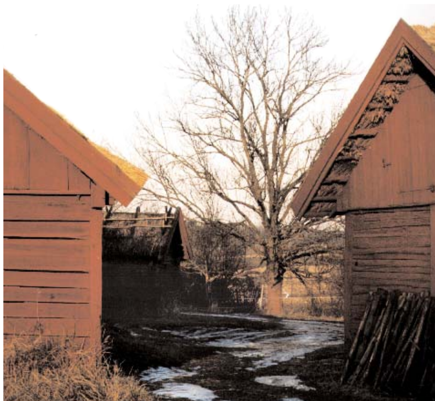
I åtgärdsplanen för Viby vill man återskapa en siktlinje mellan Venngarns slott och byn, ett sammanhang i landskapet som länge varit skymt av vegetation.

Annars handlar det mest om att begränsa och styra växtlighetens utbredning. I den raserade grunden till cistercienserklostret kommer lövslyet att åtgärdas. Här krävs en ganska omfattande gallring men så varsamt att sterna till den gamla grunden inte rubbas. Venngarns slott, som ligger två kilometer norr om byn, kan inte längre urskiljas för en massiv ridå av lövträd. Att återskapa en siktlinje mellan slottet och byn ingår också i åtgärdsplanen. Den gärdesgård som nu sätts