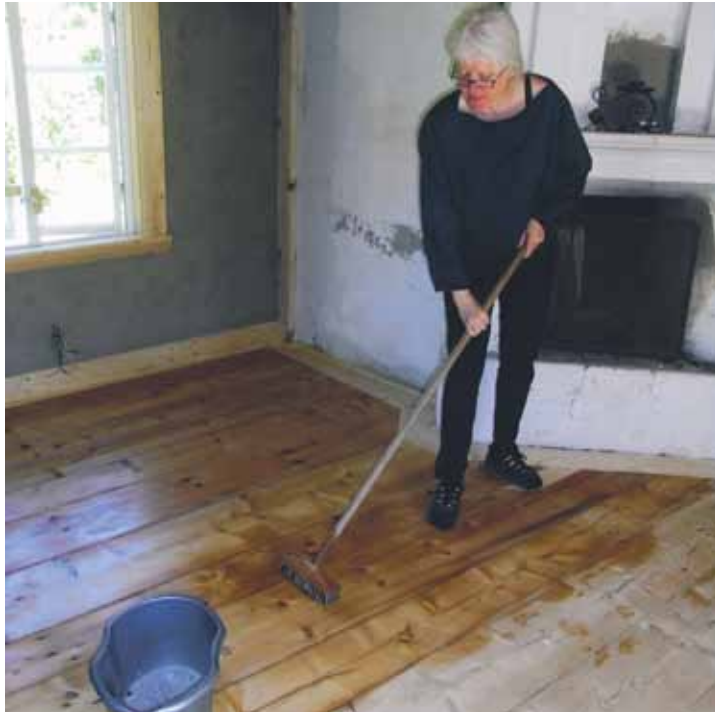
Skura golvet i träets längdriktning med skurborste på skaft.