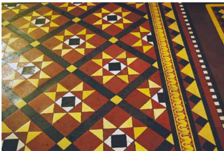
Uppsala universitetshus står med vackra golv, som här i trapphallens mönsterlagda tiles.

OBS! Äldre keramiska plattor har inget ytskydd, därför tillförs olja eller vax. Använd inte oljor eller vaxer på keramiska plattor, om det inte har gjorts tidigare.