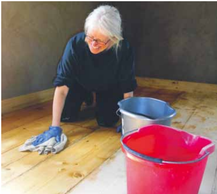
Skölj golvet med vatten. Här används en skurtrasa. Vrid ur trasan i en hink, skölj i den andra. Handskar och knäskydd underlättar skurningen väsentligt.