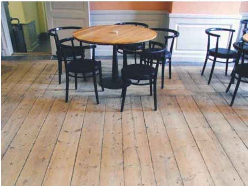
Såpaskurat trägolv i personalköket i Södra Bankohuset på SFV:s huvudkontor.