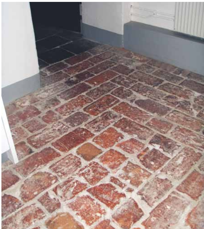
Tegelgolv med lösa fogar i Södra Bankohuset.

OBS! Man kan inte olja, såpaskura eller lägga på en skyddande hinna på tegelgolv med lösa fogar.