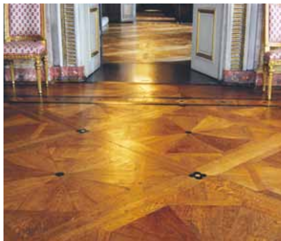
Bonvaxat golv på Stockholms slott.

OBS! Lacknafta är brandfarligt. Följ anvisningar för hantering och förvaring.