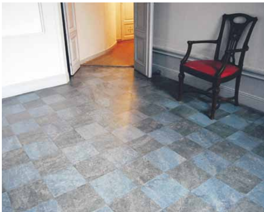
Bilden visar ett exempel på ett välskött mönsterlagt linoleumgolv som är från 1940-talet. I det närliggande rummet anar man en linoleummatta i ekimitation.