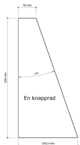
Bilder i profil av tablåer:

Anropstablå utföres infälld i första hand. Knapparnas centrum, gäller destinationsknapp, nödsignalknapp, nyckelbrytare och dörröppningsknapp, ska placeras mellan 900 mm och 1000 mm över golv. Anropsknappar placeras högst 900 mm ÖFG. SFV har valt att föreskriva att såväl väningsplanens som korgens färdriktnings- och stannplansindikatorer samt anropsknappar om möjligt ska placeras vid dörr till höger, ej ovan dörr.