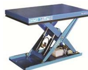
Exempel lyftbord, övervåg ramp i första hand

Lyftbord är en avvikelse som måste godkännas innan och diskussion ska tas med anvisningsansvarige innan. De tillåts bara för lastintag för storkök om ingen annan lösning är möjlig. Lyftbord ska ha dubbelverkande hydraulcylinder med rörbrottsventil och återkoppling till tank och vara i utförande för utomhusmontage, minst varm-förzinkat utförande samt med hålldonsmanöver. Avvattningsgrop med värmslinga ska finnas vid utomhusmontage. Beakta kraven i för lyftbord i AFS 2008:3 där SS-EN 1570-2:2016 ger hjälp att uppfylla kraven.