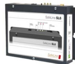
Exempel Safeline SL6.

Text på knappar ska vara tydligt markerad i upphöjd relief (taktila) och ha stora tydliga våningssiffror i ljus kontrast (0.40 NCS). Siffror och bokstäver ska vara i ett lättläst typsnitt utan cerifer och ej vara kursiv. Text i relief ska bestå av versaler. Brilleskrift utföres ej på tryckknappar. Om texten är lysande är vit text på mörkt underlag att föredra. Text vid nödsignalknapp ska vara "Håll nedtryckt 10 sek för larm" även i Braille. Panelplåt bör kontrastera mot såväl knappar och text som bakomliggande vägg. Blanka material som ger upphov till speglingar och reflexer ska ej användas.