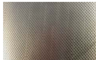
Exempel rostfri dekor 9

Synliga stålvaror och dylikt för dörrmaskineri ovan dörrar ska täckas med plåt mot skadegörelse. Dörrmaskinerier/ bärenheter