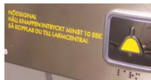
Exempel brailleskrift och text vid nödsignalknapp. OBS ej Braille i knapp.

Destinationstablå och anropstablåer ska vara graverade och färgfyllda i vit kulör. På tablå får bara maxlast ingraveras, ej hiss-ID eller dylik information. Ovidkommande text (tillverkarnamn, logotyper etc.) ska inte förekomma (om tablå absolut inte går att få utan sådan text, ska den vara längst ned och inte misstas för knapp och inte heller vara i relief).