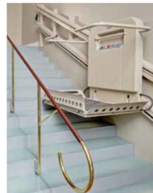
Exempel trapphiss Trapphiss behöver inte nödtelefon

Rullstolstrapphissar bör undvikas och är en avvikelse från denna anvisning som måste godkännas skriftligen. Diskussion ska tas med anvisningsansvarige innan. De är ofta en enkel klen hisskonstruktion. Rullstolstrapphissen ska vara för publik miljö och ha sådan kvalitet att den fungerar även vid stillastående i flera år. Anropsknappar ska utföras i vandaltåligt material och förses med nyckelbrytare för skandinavisk oval-cylinder. Rörliga delar som bommar, armar och dylikt ska vara vandaltåligt utförda för publik miljö och fällas in bakom uppfällt golv. Beakta kraven för trapphiss i AFS 2008:3 där SS-EN 81-40 ger hjälp att uppfylla kraven)