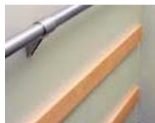
Exempel avbärrarlistor, men ska vara 3 rader

4 SDCM eller bättre , varmvit 3000K av känt europeiskt fabrikat, med en livslängd om minst 25 000 h. Korgen ska ha samma luxkrav som stannplanet, dock lägst 200 lux (800 mm ÖFG). Nödljus utföres med vit lysdiod i tak. (Beakta att fotocellridån, passagerardetektor, kan öppna dörrar i onödan vid många personer i korg, svårt köra hiss).