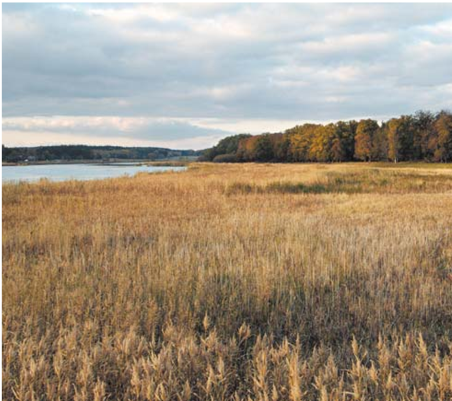
Betade strandängar är en viktig del av landskapsbilden kring Svartsjö slott, och där gynnas också fågelliv och en rik flora.

stora djurgården, var det jakten som lockade de kungliga till Svartsjö. Kung Johan slog också samman flera kronohemman och lade grunden till den nuvarande kungsgården som var «till kongl. hovhållningen nödig och nyttig».