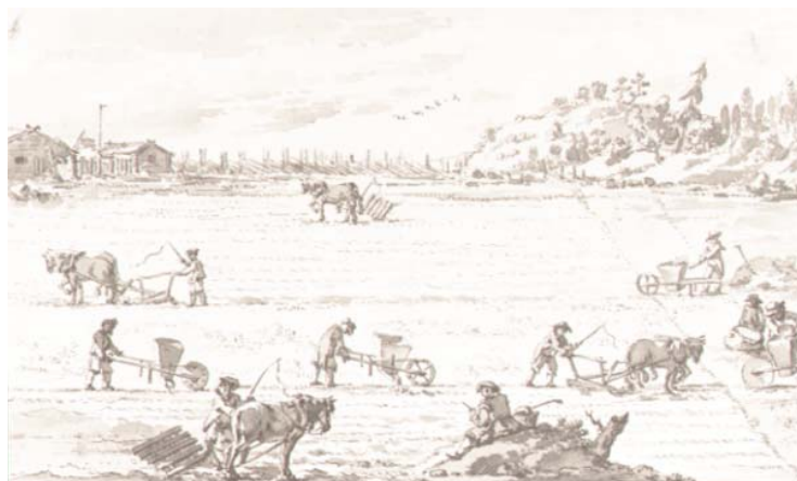
Denna propagandistiska bild av arbetet på åkern illustrerar frihetstidens försök med nya jordbruksredskap. Lavering från mitten av 1700-talet av Jean Eric Rehn.

STATEN HAR I DAG kvar en bråkdel av sitt forna jordinnehav. I samband med Domänverkets bolagisering i början av 1990-talet blev det nödvändigt att välja ut de jordbruksegendomar som hade så stora kulturella och historiska värden att de borde behållas i statens ägo som nationellt kulturarv. Urvalet blev mycket restriktivt och innebar att ett 30-tal kungsgårdar fördes över till Statens fastighetsverk. Sedan dess har staten köpt in ytterligare några skyddsvärda egendomar med historisk anknytning till kronan. Varje kungsgård har sin egen historia. Vissa har dragits in till kronan i samband med reformationen eller Karl XI:s reduktion, medan andra sedan urminnes tider varit knutna till de kungliga slotten och hovets försörjning.