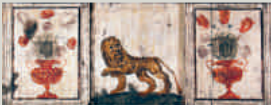
Framed motifs on the painted beamed ceiling from the 1640s above the mezzanine.

The Stenbock Palace was acquired by the State in 1772 to house the Royal College of Commerce. In 1865 the National Archives moved into the palace, which was subsequently joined to a new building now known as the Old National Archives. The Stenbock Palace was restored around 1970 when the Supreme Administrative Court, moved in. The building is managed by the National Property Board Sweden (SFV).