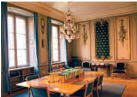
Kommerskollegierummet med inredning från 1770-talet.

SFV har tagit fram ett speciellt vårdprogram för att säkerställa att palatsets kulturvärden inte går förlorade i framtiden. Stenbockska har två viktiga historiska lager: stomme och murverk från 1600-talet och en