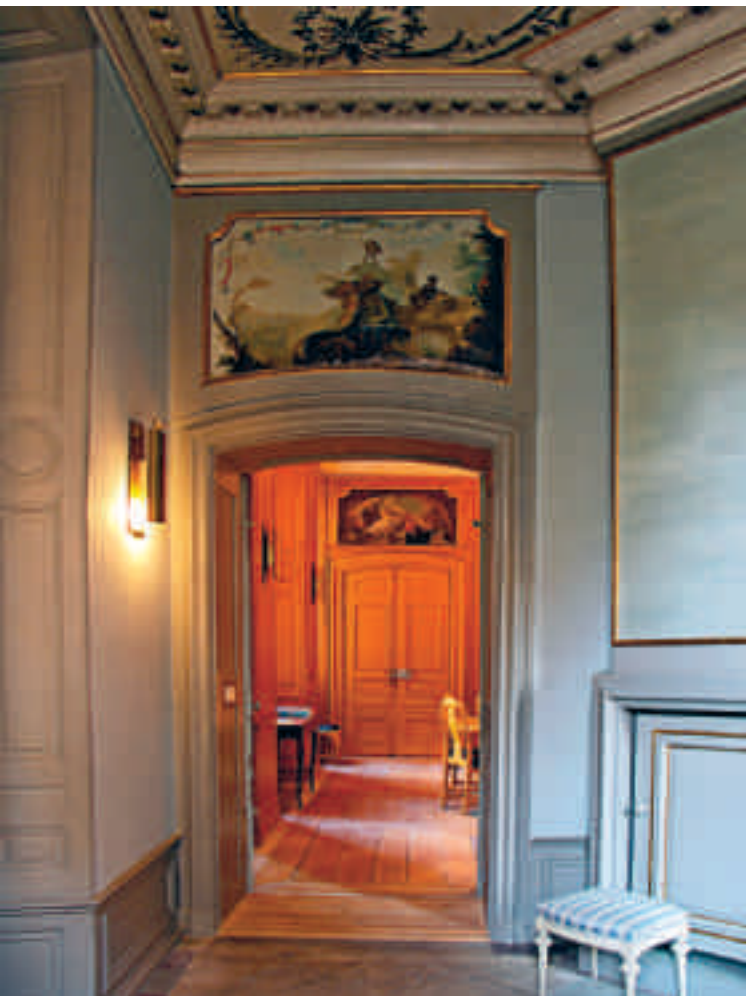
Aprummet, tidigare kabinett, med dörr mot en plenisal.