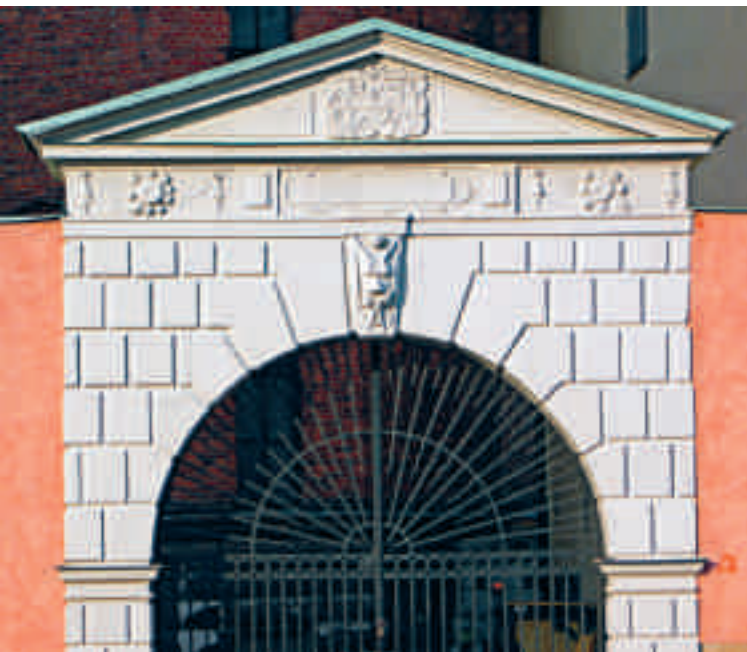
Inkörsporten med byggherrens alliansvapen, Fredrik Stenbock och Katarina de la Gardie.