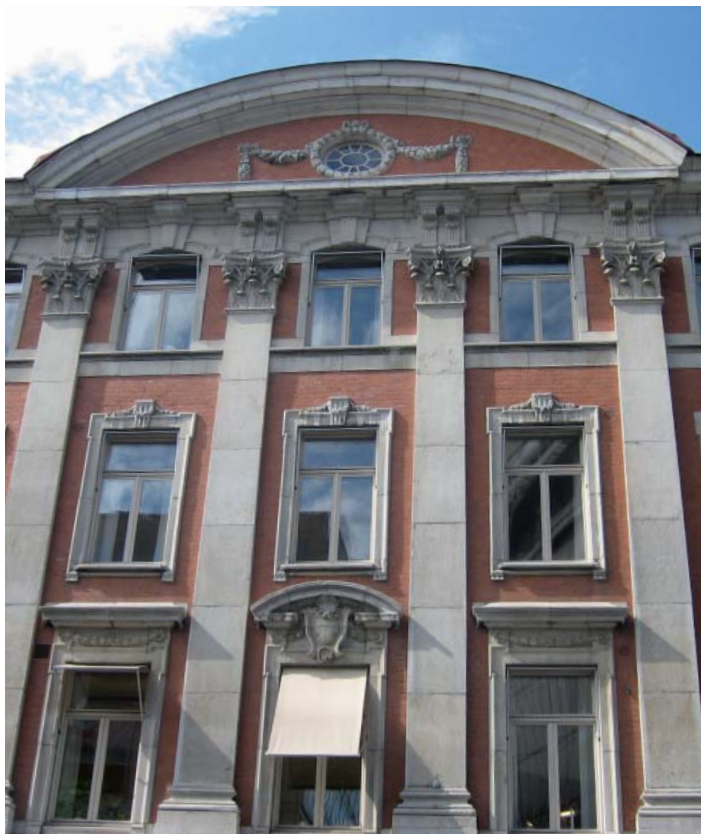
Butikslokal mitt i city, Malmstorgsgatan 5, Stockholm.