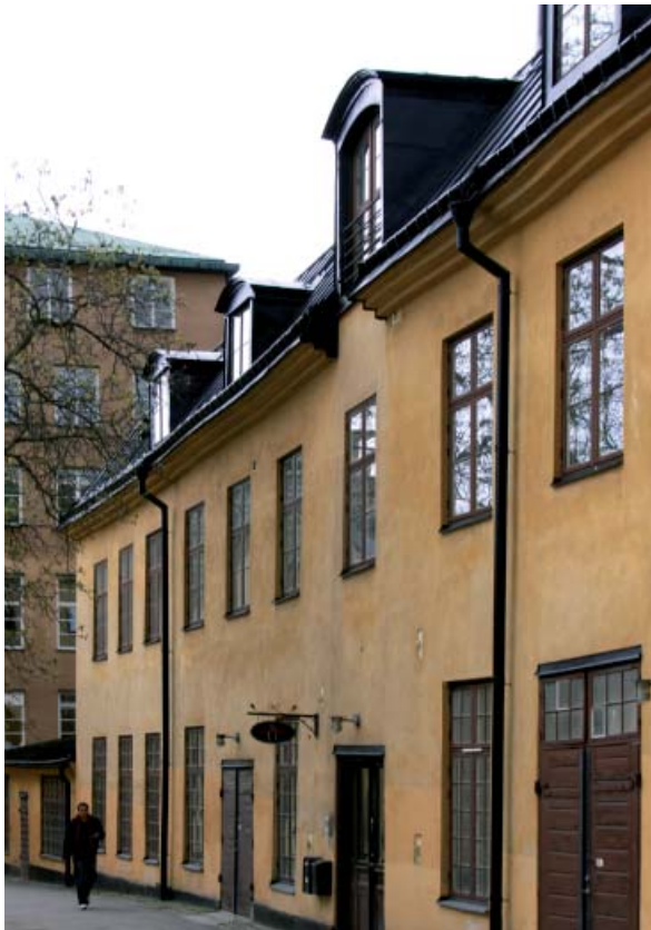
I Kungliga Myntet på Kungsholmen finns också lediga lokaler för uthyrning.