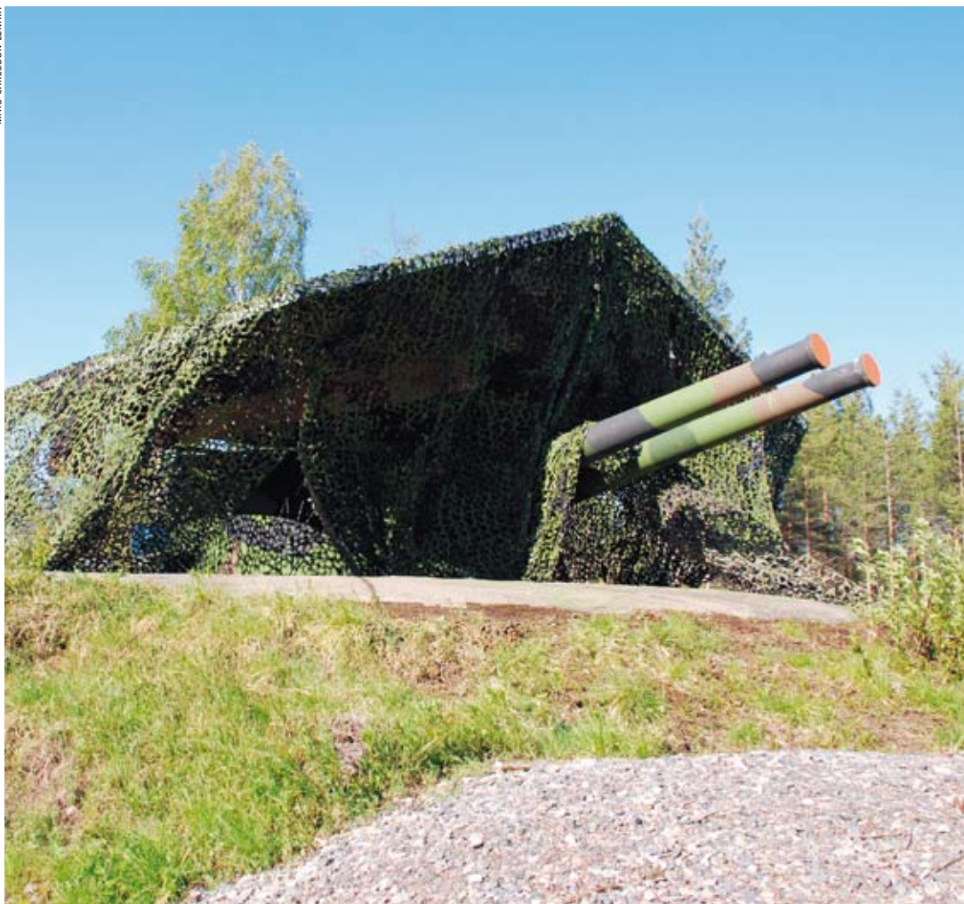
På toppen av skidbacken i Vuollerim står ett till synes oansenligt skjul med dubbelkanoner från pansarskeppet Drottning Victoria.