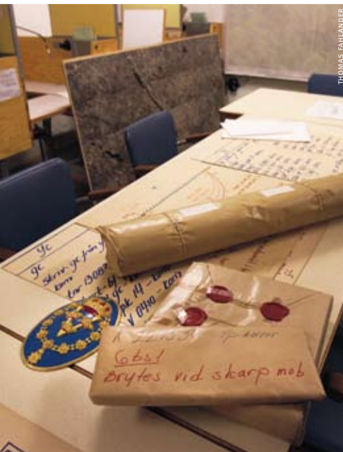
Taktikrummet med hemliga planer i förseglade paket.

nerströms fall fick återverkningar på bygget av Victoriafortet. Man ville inte riskera att fienden skulle känna till anläggningen i detalj innan den ens var tagen i bruk. Därför spegelvändes hela den inre planeringen av berganläggningen.