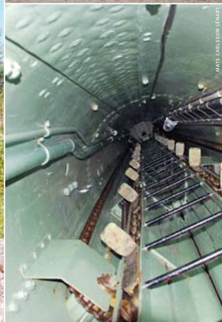
Personalen fick klättra på en steg i ca 15 meter för att komma upp i kontoret.

INTE ENS de flesta bybor i Vuollerim kände till hemligberget under skidbacken. Ja, kanske man hade förstått att det fanns något i berget, ett militärförråd kanske, men att det var en stor och strategisk försvarsanläggning och del i den sista skyddsmuren av Sverige från öster förblev en hemlighet för flertalet.