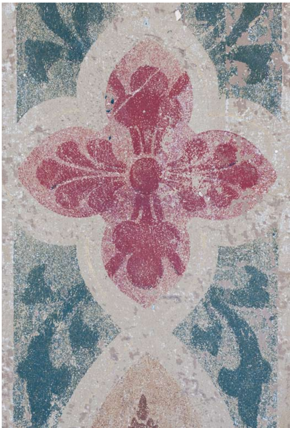
Detalj av schablondekore- rad pilaster, framskrapad under flera lager senare färgskikt.

Hyresgäst är det närliggande Hotel Skeppsholmen.