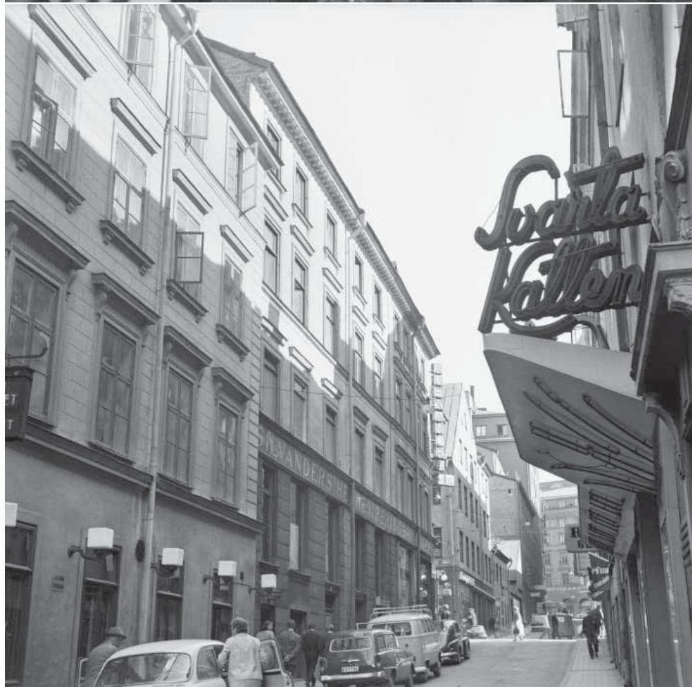
Vattugatan österut mot Brunkebergstorg 1964. Mitt emot källaren Tennstopet ligger biografen Svarta Källaren som, tillsammans med biograferna London och Hollywood i grannkvarteren, bjöd på kortfilmsprogram med journalfilmer blandat med musikfilmer och tecknat.

Mycket av historien och historierna från Klara kretsar kring restaurangerna och på en liten yta fanns verkligen ovanligt många restauranger efter dåtida svenska förhållanden. Rosenbad var guldkrogon, men frekventerades ändå gärna till vardags av tidningsfolk och helst av Svenska Dagbladets medarbetare. Bakfickan som i dag kallas 'Gyllene matsalen', var särskilt populär. Restaurangen upphörde dock re-