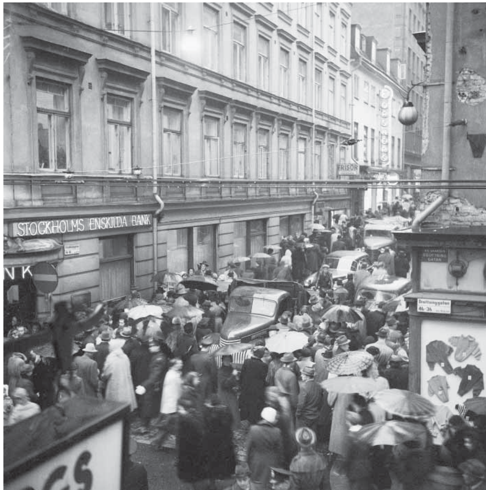
Hörnet Drottninggatan/Klarabergsgatan 1952. Det kommer att dröja ytterligare några år innan stadsdelen ska få sin första gågata. Till dess får fotgängare och bilar samsas så gott det går.