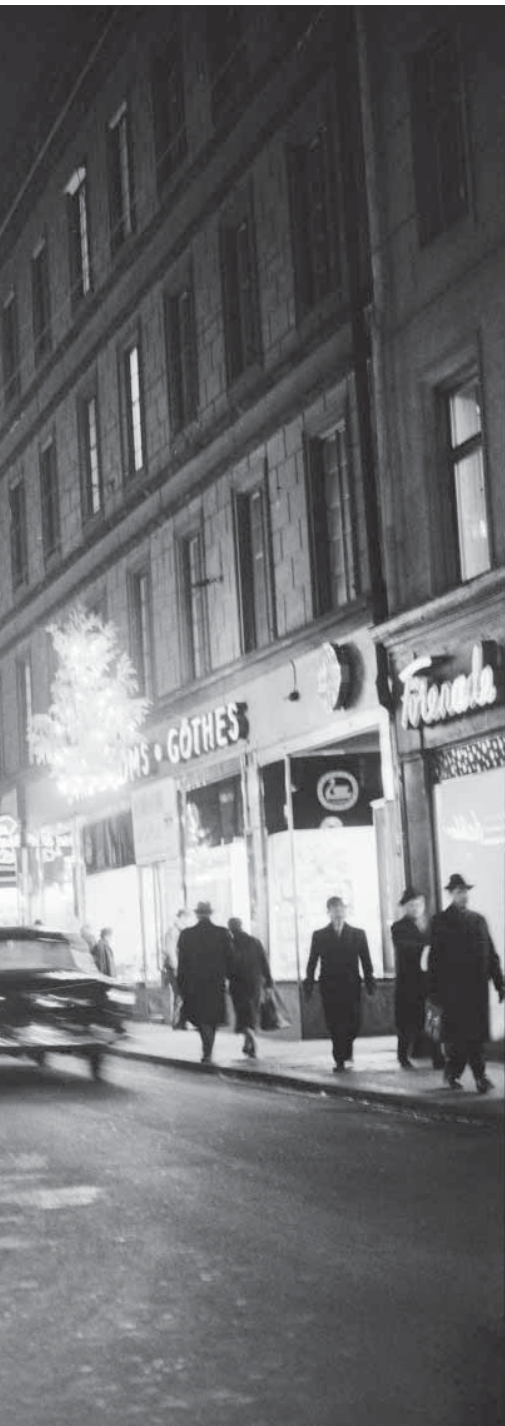
Drottninggatan norrut från Karduanismakargatan julen 1957. Drottninggatan behöll under hela femtiotalet sin ställning som Stockholms ledande affärsgata.

”på 1950-talet gavs där ut sex dagliga tidningar”