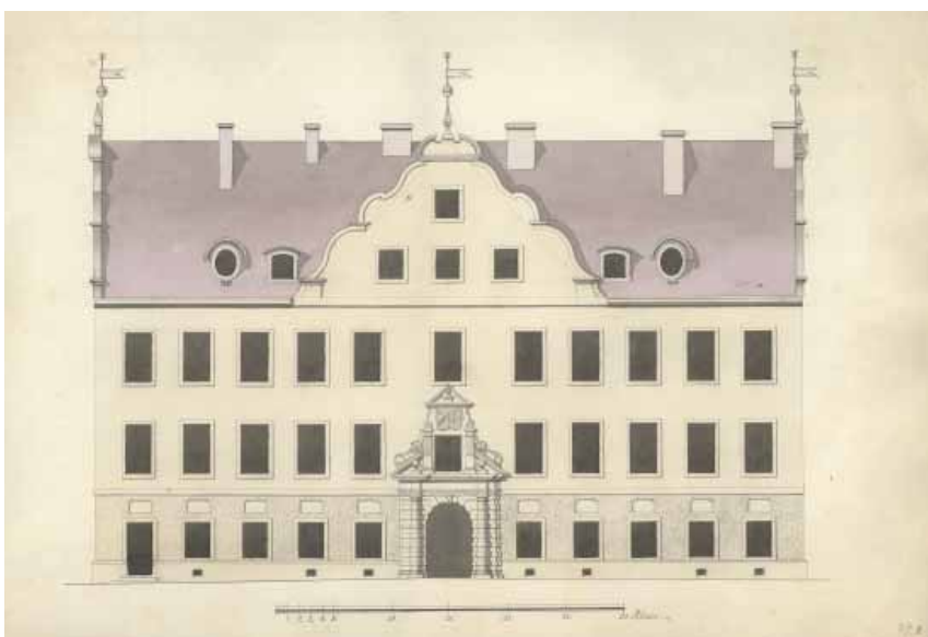
Uppmåtningsritning av Lennart Torstensons palats. Det uppfördes 1647-51 och ingår i nuvarande Utrikesdepartementets byggnad. Mot Fredsgatan visar det upp sin välbevarade 1600-talsfasad med portalen som utfördes 1647 av den från Bremen inflyttade stenhuggaren Diedrich Blume.