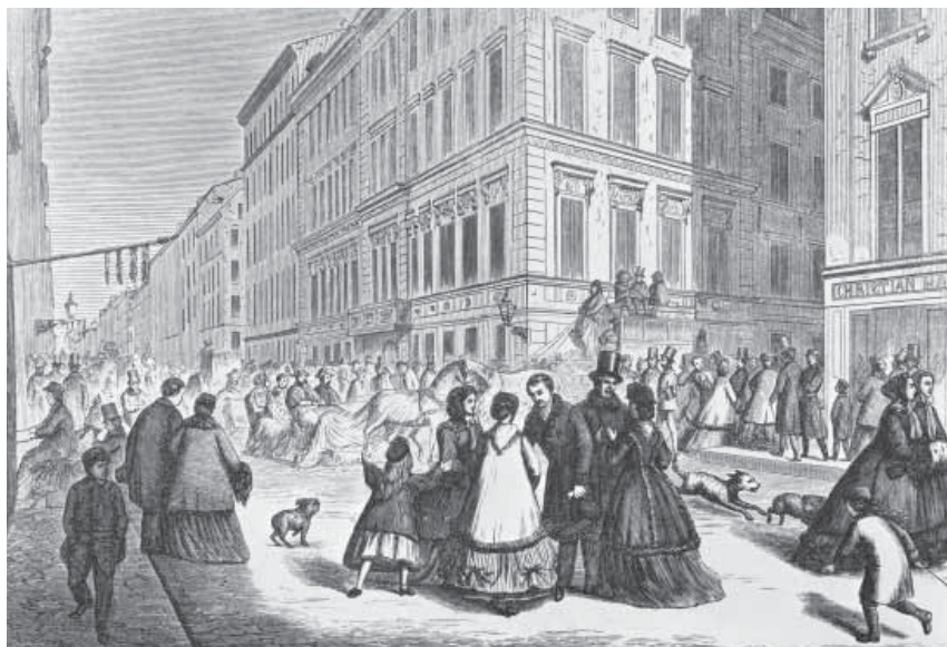
Drottninggatan blev under 1800-talet 'Snobbrännan' – ett promenadstråk för folk som ville synas. Illustration ur Ny illustrerad tidning 1867.

Givetvis var branden en katastrof, men den medförde också en förnyelse av stadsdelen vilken underlättades av att flera byggnader var försäkrade i Stockholms Stads Brandförsäkringskontor som hade startats fem år tidigare. Det avbrända området återuppbyggdes ganska raskt med