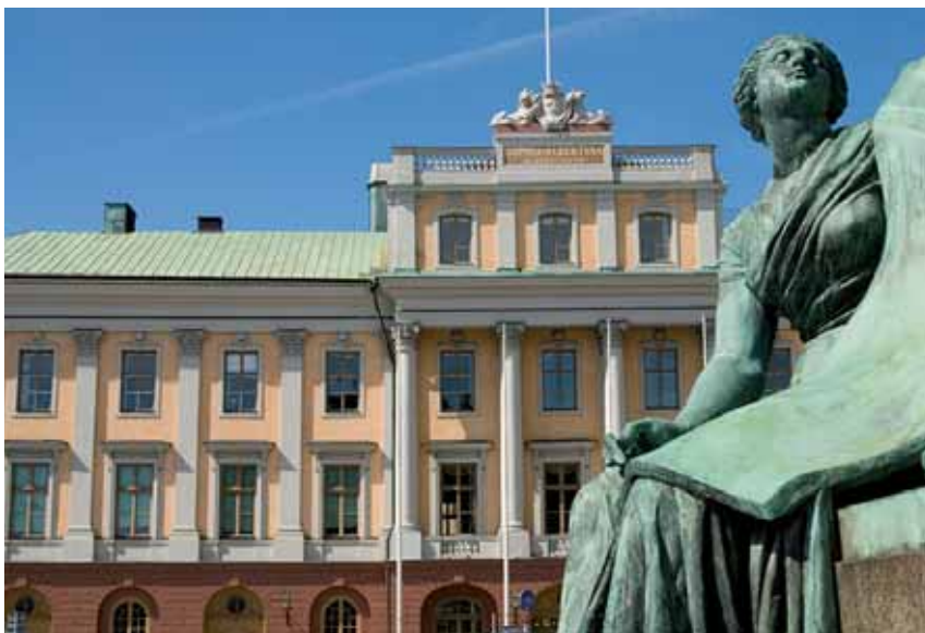
Arvfurstens palats, hemvist för utrikesdepartementet. I förgrunden syns en detalj av Tobias Sergels skulpturgrupp nedanför L'Archevêques Gustav II Adolfs staty.

Vid de större gatorna byggdes ett slags standardhus av tegel. De var tre våningar höga och fem fönsteraxlar breda. Källarna var välvda och på bottenvåningen fanns ofta bodar och magasin. På varje övervåning fanns mot gatan en sal med tre fönster och ett mindre rum med två fönster. Mot gården fanns två sådana mindre rum på vardera sidan av ett trapphus. På går-