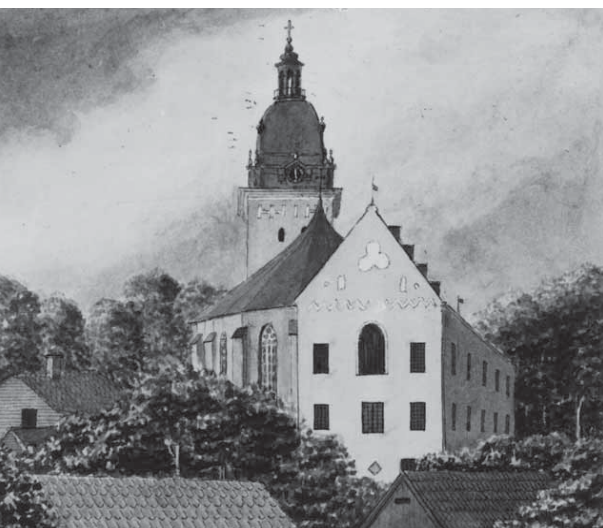
J. G. Schultz tuschlivering från 1843 visar Roggeborgen som den såg ut efter 1715 och fram till 1860-talet.