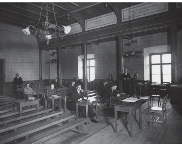
Rikssalen som aula och skrivsal i Gamla läroverket 1935.