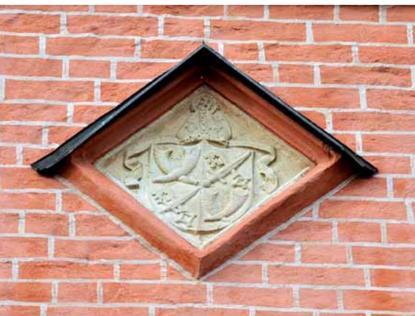
Kort Rogges vapen sitter i dag inmurat i östra gavelns bottenvåning.