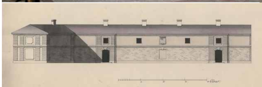
Carl Hårlemans ritning av södra fasaden. Fönstren i bottenvåningen togs upp först på 1820-talet.

En detalj ur Erik Dahlbergs Suecia visar muren som löpte mellan Gamla bibliotekshuset och Domkapitlets hus.