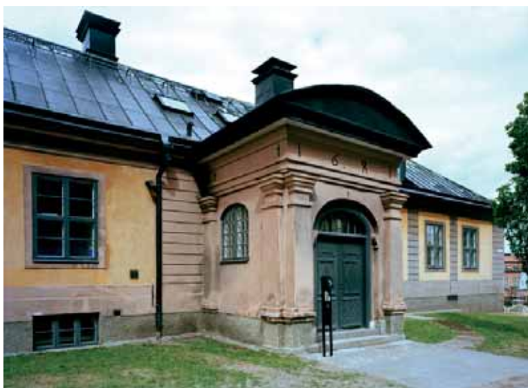
Ecclesiasticums ingång från Domkyrkoplan. Portalen uppfördes 1681.

Konsistoriehuset är ett bra exempel på hur vårt kulturarv bevarats genom ombyggnader för nya funktioner in i vår tid. Husets arkitektoniska värden och antikvariska aspekter har fått en allt större betydelse i arbetet efter hand, och i dag är det givet att inte göra större förändringar än nödvändigt. Upplevelsen av rummen är inte mindre viktig. Nyttillskotten ska hålla en hög kvalitet i design och material. I Konsistoriehuset är inredningen funktionell och diskret tilltalande, i konsekvens med Hårlemans intentioner. KV