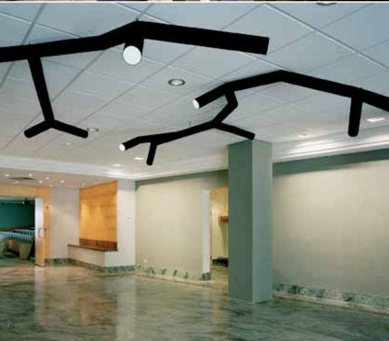
Sveriges EU-kontor i Bryssel.