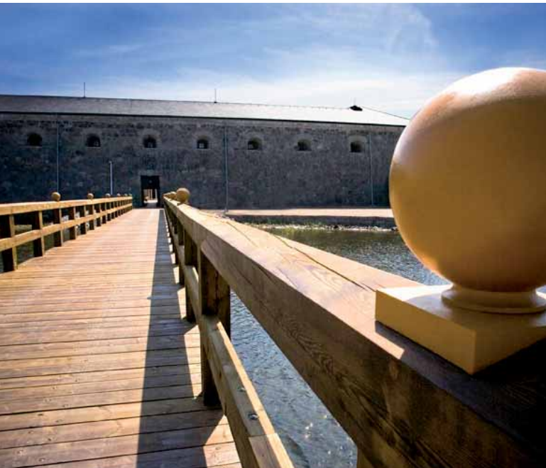
Nygammal bro till Drottningkärs kastell.