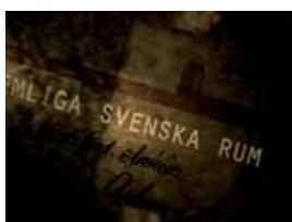
Hemliga rum – svt 1 söndagar klockan 19.15.