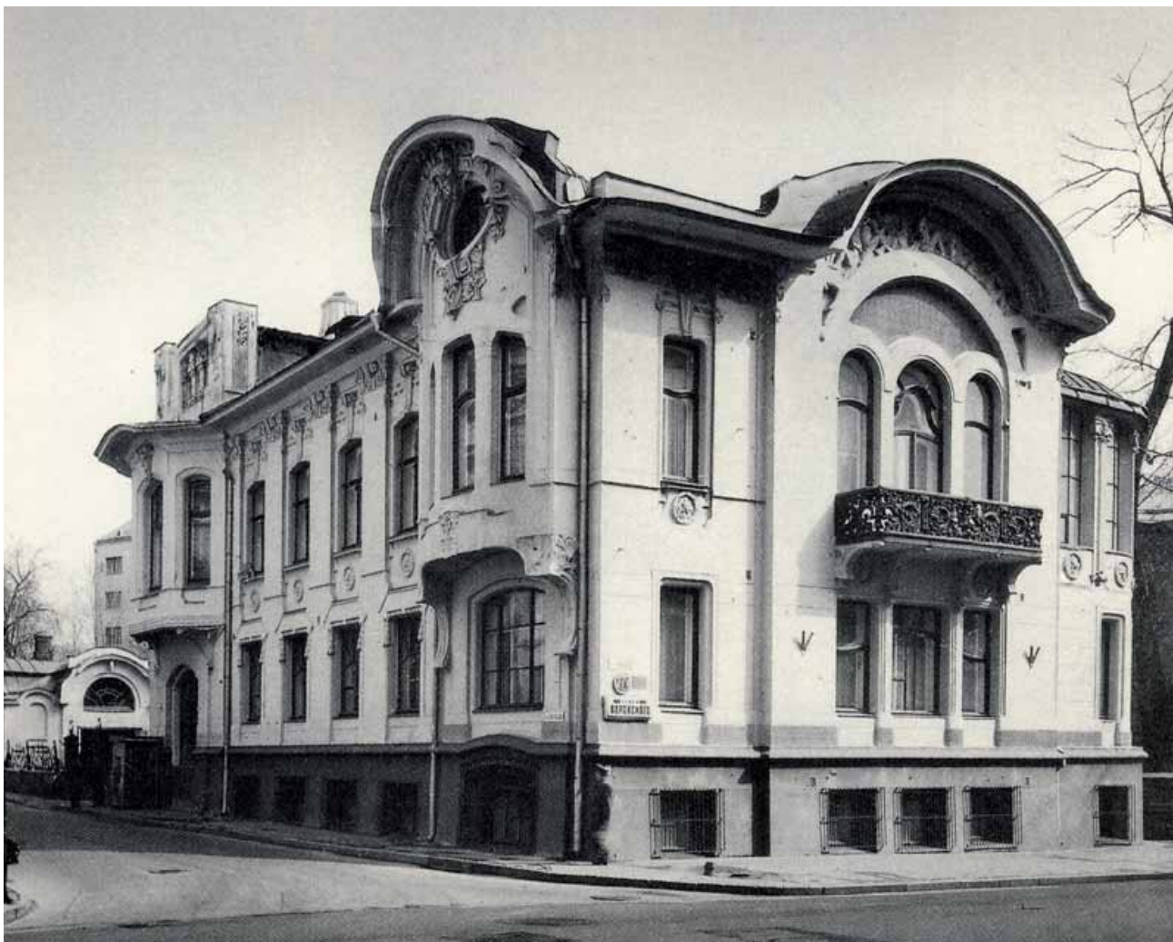
Huset på Vorovskigatan var byggt på 1890-talet och hade tidigare huserat Vatikanens beskickning i Moskva.