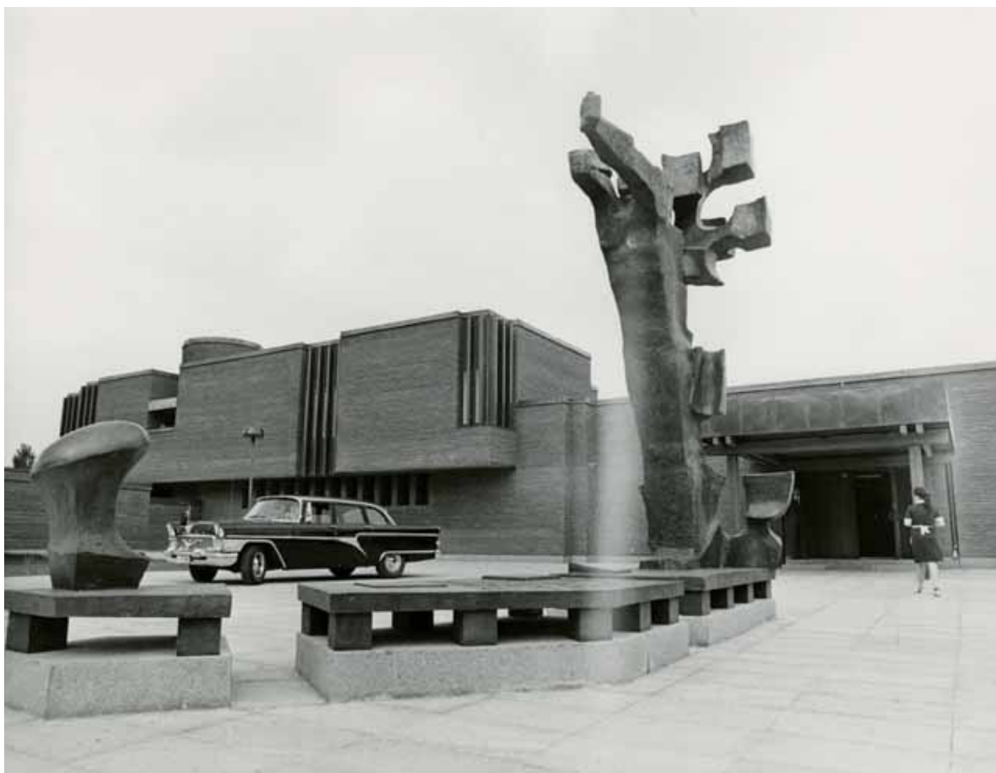
Ambassadens gård domineras av Bror Marklunds skulptur Gestalt i storm .

Det skulle dock dröja hela sex år innan grundstenen till Sveriges nya hus i Mosk-