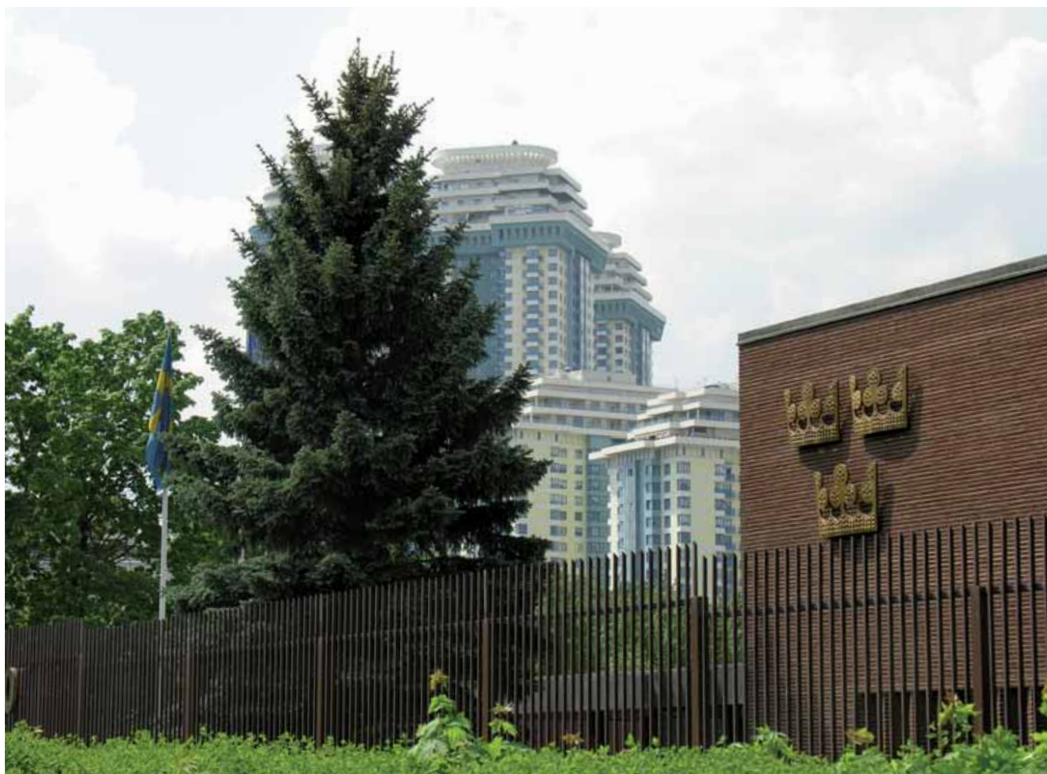
När Sveriges ambassad i Moskva invigdes 1972 omgavs den av rena landsbygden på det område som då hette Leninbergen men numera Sparvbergen. Nu ligger ambassaden i stadsmiljö med nya 40-50-våningshus alldeles i närheten.

Först den 2 juli 1968 inleddes bygget i Moskva och den 1 mars 1972 utväxlade Sverige och Sovjetunionen nya ambassader under pompa och ståt. KV