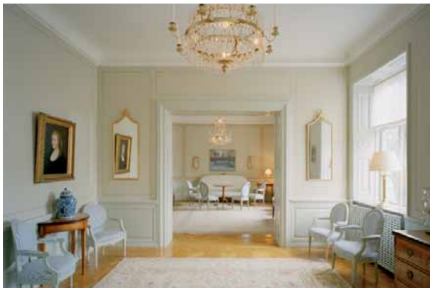
I Gustavianska salongen och Inre salongen har väggarna fått en enkel fältindelning på 1700-talsmanér.

I matsalen, som är våningens största rum, har väggarna återfått sin gröna färg från 1905 medan panelerna har målats i engelskt rött i en färgställning som hämtats från Rosenbad, som likt de båda kakelugnarna är ett verk av Ferdinand Boberg. Det stora matsalsbordet är ritat av Carita Kull och specialtillverkat hos Eriksson & söner i Vrena. Stolarna är tillverkade av Åmells i Gnesta. Ljuskronan är ett modernt italienskt arbete, medan mattan är egyptisk och kvällssolen kan sila in genom schweiziska gardiner. KV