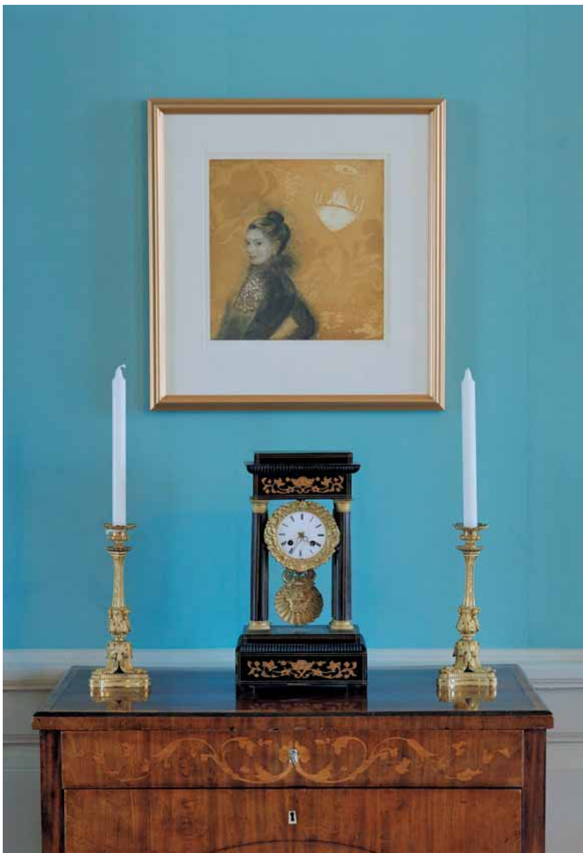
Byrå med ljusstakar och bordspendyl från 1800-talets början i Karl Johansalongen.

länsarkitekt i Älvsborgs län 1925–50. Inför ombyggnaden fick residenset skydd som byggnadsminnesmärke, numer statligt byggnadsminne. Ombyggnaden innebar bland annat att bottenvåningen i det härlemanska huset kontoriserades och att de båda flyglarna mot torget uppfördes 1943–44.