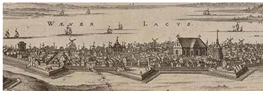
På kopparsticket i Erik Dahlbergs Suecia Antiqua et Hodierna från slutet av 1600-talet kan man se det gamla residenset med sina höga valmade tak vid torget till vänster om kyrkan.