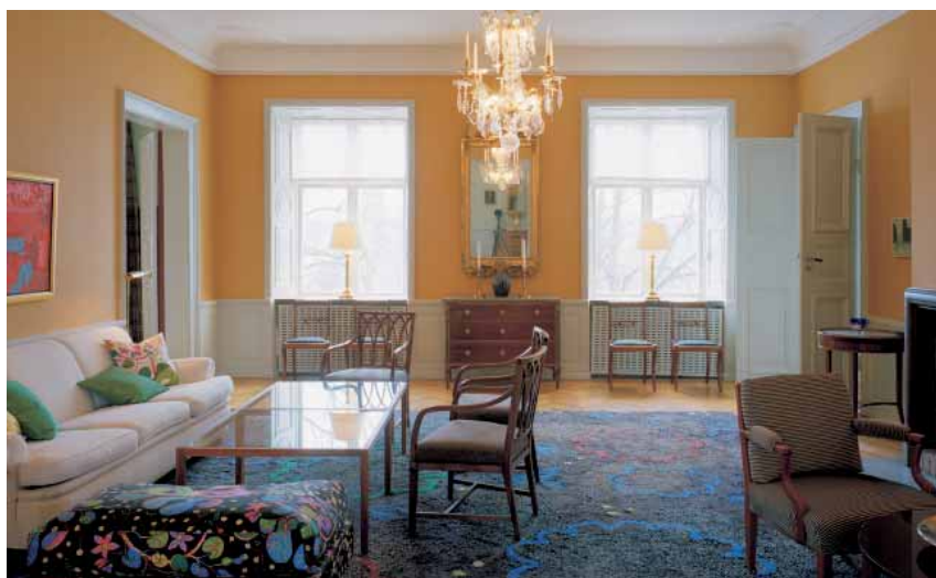
I sällskapsrummet möts en blandning av gammalt och nytt. Mattan och soffbordet i glas och trä är formgivna av Carita Kull.