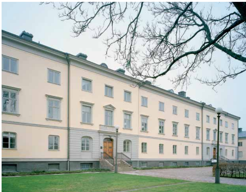
Residenset fick sitt nuvarande utseende efter en om- och tillbyggnad som avslutades 1848. Den nya fasaden ritades av arkitekten Carl Gustaf Blom Carlsson.