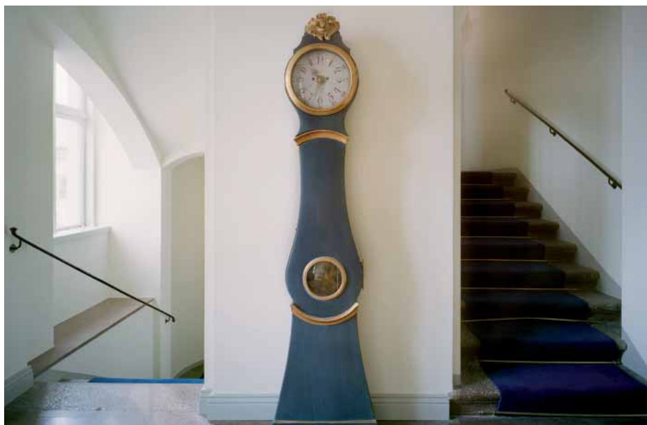
Trapphuset med sitt golvvur präglas av svensk rokok.

offentliga byggnadsväsendet i Sverige. År 1746 hade Konungen fastställt ett av Hårleman utarbetat typförslag till landshövdingeresidens. Den graverade och tryckta versionen omfattar sex ritningar – nämligen tre planer, två fasader och en gavelfasad med sektion. Förslaget ingår i en serie av mönsterritningar som förutom landshövdingeresidensen omfattar huvudbyggnader på kungsgårdar, översteboställen, överstelöjtnants- och majorsboställen, kaptensboställen samt löjtnants- och fänriksboställen.