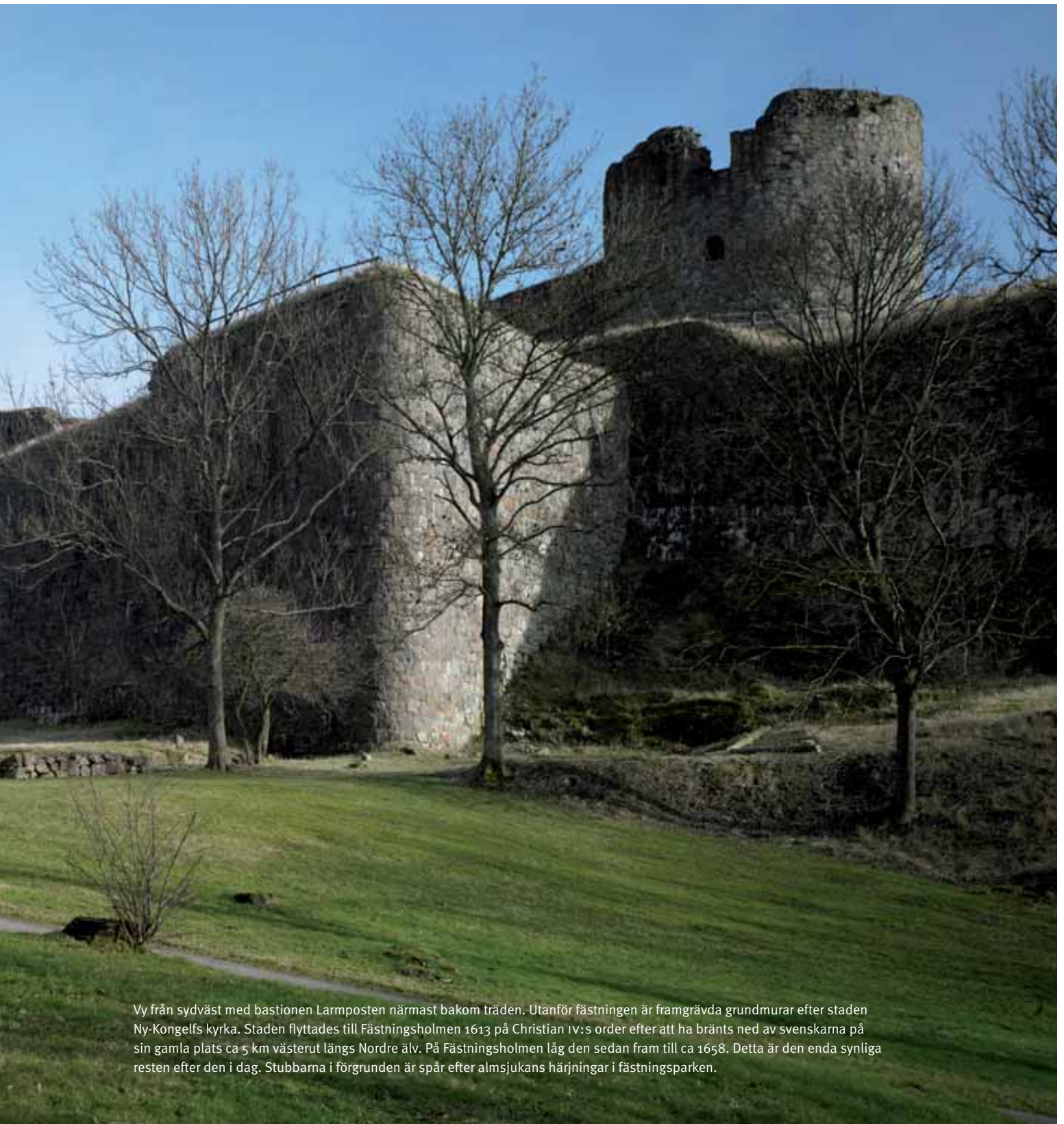
Vy från sydväst med bastionen Larmposten närmast bakom träden. Utanför fästningen är framgrävda grundmurar efter staden Ny-Kongelfs kyrka. Staden flyttades till Fästningsholmen 1613 på Christian IV:s order efter att ha bränts ned av svenskarna på sin gamla plats ca 5 km västerut längs Nordre älv. På Fästningsholmen låg den sedan fram till ca 1658. Detta är den enda synliga resten efter den i dag. Stubbarna i förgrunden är spår efter almsjukans härjningar i fästningsparken.

Norden på 1100-talet. Magnus Barfots son, korsfararen Sigurd Jorsalfare som blev norsk kung 1103, sägs till och med ha haft planer på att göra Kongahälla till huvudstad i sitt nordatlantiska imperium.