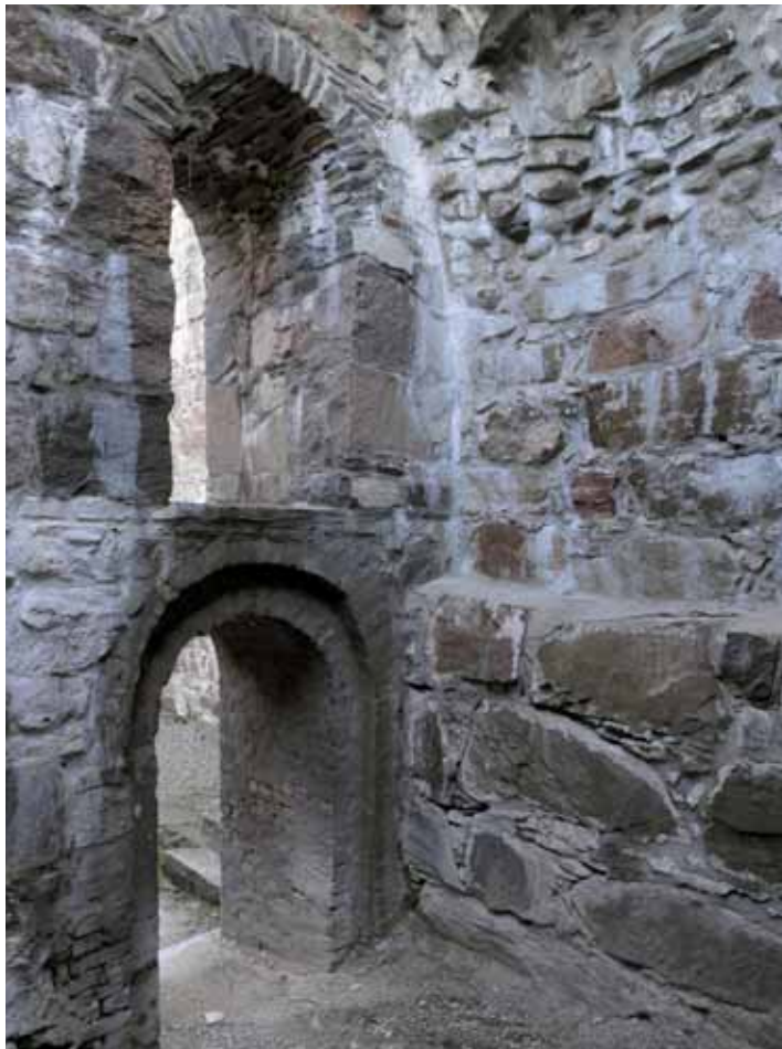
Två restaurerade dörröppningar inuti Gamla magasinet.