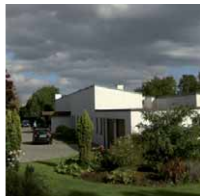
Sveriges ambassadresidens i Dublin, Irland.