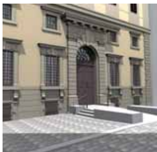
Förslag till värdig entré vid Södra Bancohuset i Stockholm.