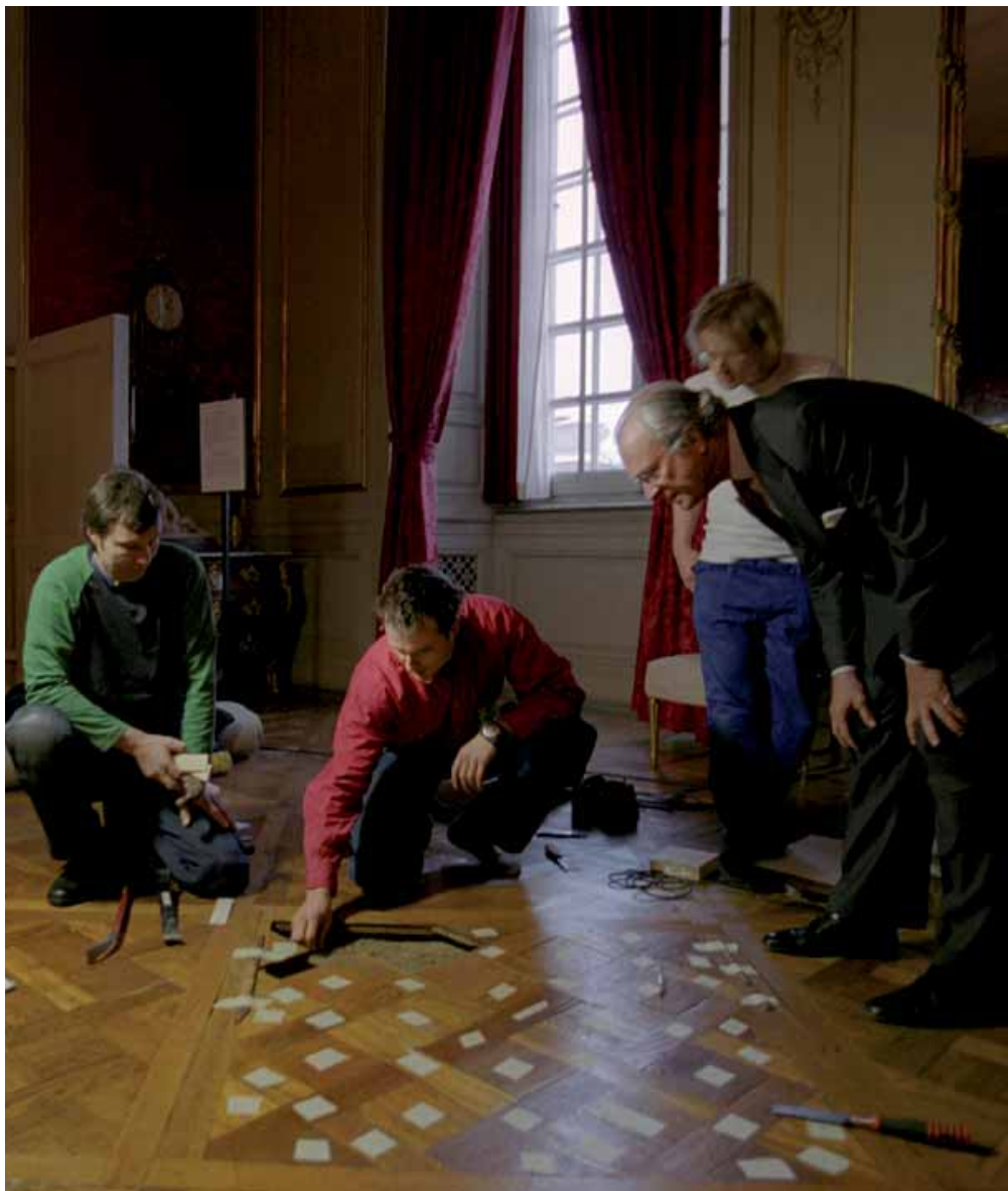
Kungen följer intresserat med i renoveringsarbetet.