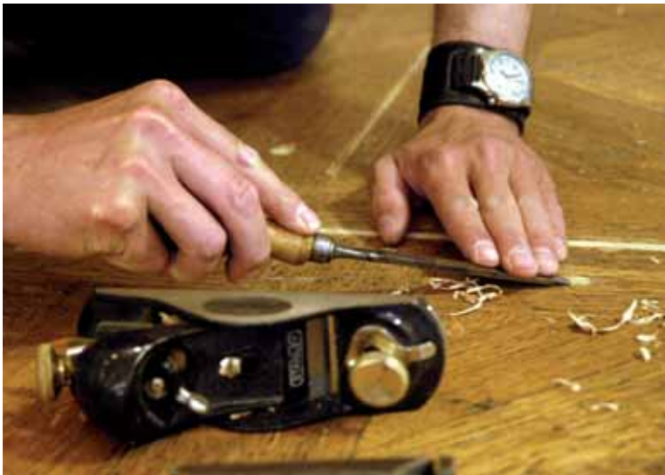
Skruvarna i de gamla spikhålen döljs av träpluggar som jämnas av och färgas in med parketten.