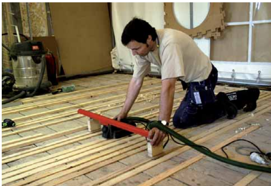
Slipmaskinen är monterad i en hembyggd släde som gör att det blir rätt nivå över hela golvet.

en byggarbetsplats. Allt ska vara klart till Nobelmiddagen den 11 december, dagen efter prisutdelningen.