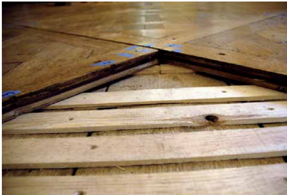
Parkett-tavlorna vilar stadigt på golvläkten och fästs i undergolvet med skruvar genom de gamla spikhålen.

Även om det är svårt att avgöra exakt vad som gjorts vid de olika tillfällena och i vilka rum kan man dock dra slutsatsen att golven varit föremål för många reparationer genom åren. Ibland har det skett efter någon stor festlighet som i januari 1778. Då fick man laga golvet i Stora galleriet efter skador som inträffat vid en maske-