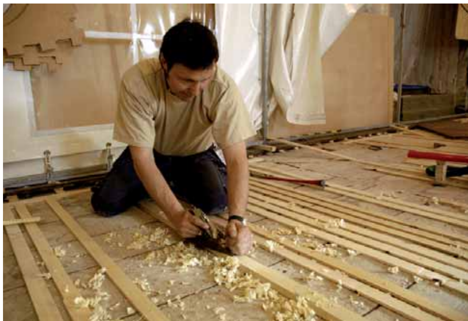
Som underlag för de renoverade parkett-tavlor har snickarna skruvat fast läkt i undergolvet. Läkten hyvlas sedan och slipas till millimeterpassning för att parketten ska ligga stadigt.