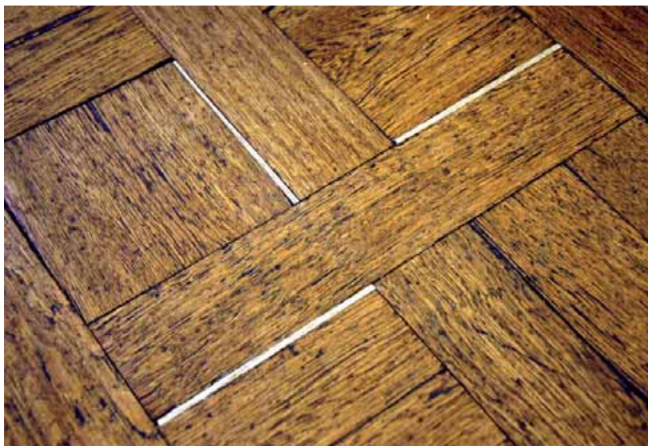
På vissa tavlor har man lagt in tunna lister där glipor uppstått i parketten. Listerna hyvlas plana med golvet och färgas sedan in med pigment och olja för att bli så osynliga som möjligt.