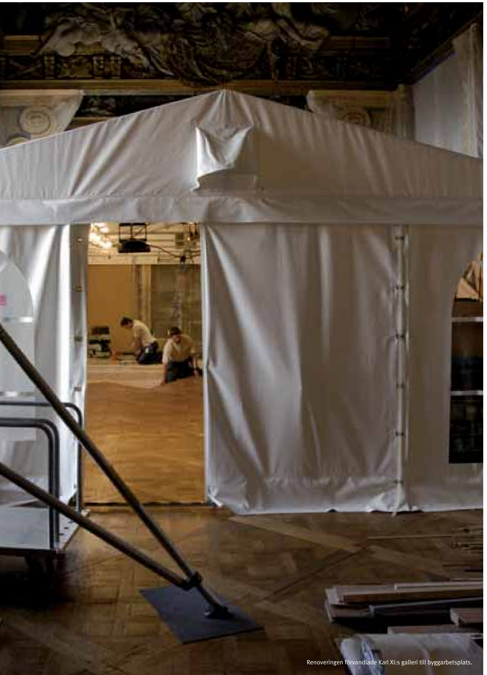
Renoveringen förvandlade Karl XI:s galleri till byggarbetsplats.