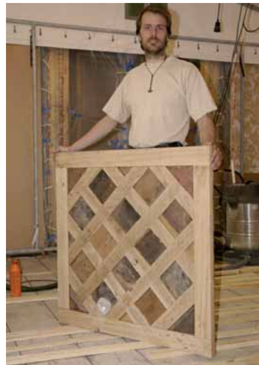
Golvet i galleriet består av 300 kvadratiske parkett-tavlor som är fästade med spånt i varandra och bildar ett vackert mönster.

De sparsamma beskrivningarna av hantverkarnas arbeten gör att det är svårt att exakt datera parkettgolven som ligger på plats i dag. Enligt uppgifter som Nicodemus Tessin skrev ner 1720 fanns det för galleriets räkning en stor del «Ekegälf, hwilka äfwenwähl färdiga ligga». Alla golvtavlor som turister och statsmän trampar på i dag är original från den tiden. I Västra gästväningen ligger flertalet av golvtavlorna orörda på sitt underlag.