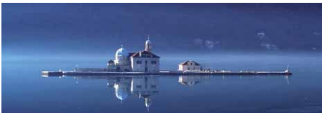
The Church of Our Lady of the Rocks in the Bay of Kotor (World Heritage Site), Montenegro. Europa Nostrapristagare 2002