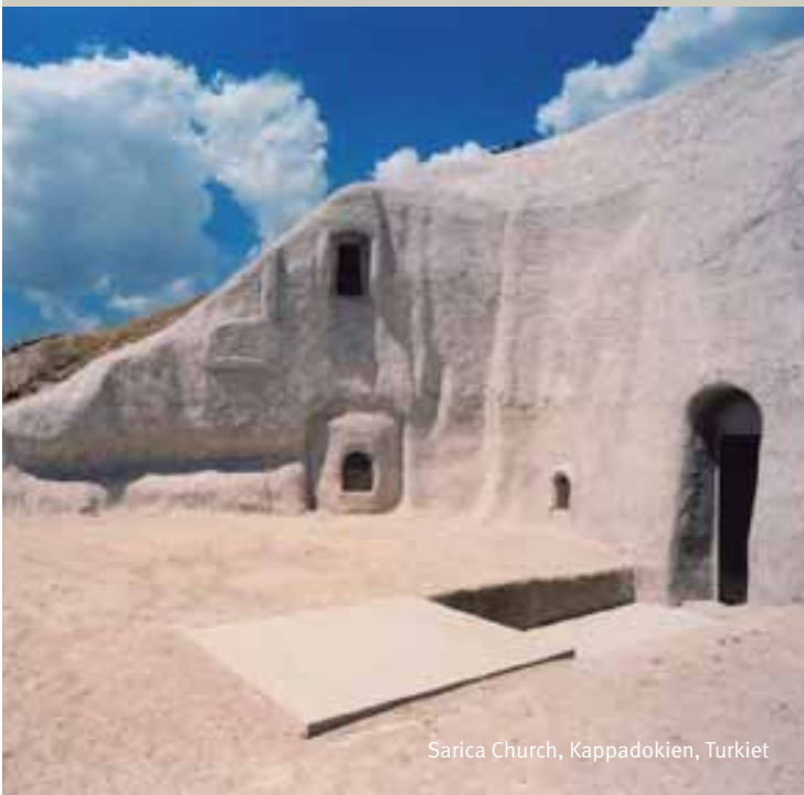
Sarica Church, Kappadokien, Turkiet

I år delades Europa Nostra Awards ut i Stockholm. Pris delades bland annat ut för restaureringen av Sarica Church, Kappadokien, Turkiet och för restaureringen av Texaco bensinstation av Arne Jacobsen 1938, Skovshoved, Danmark. I kategorin kulturlandskap gick det främsta priset till arbetet med den nästan övergivna byn Santo Stefano di Sessanio i Italien. Projektet beskrivs i följande artikel.