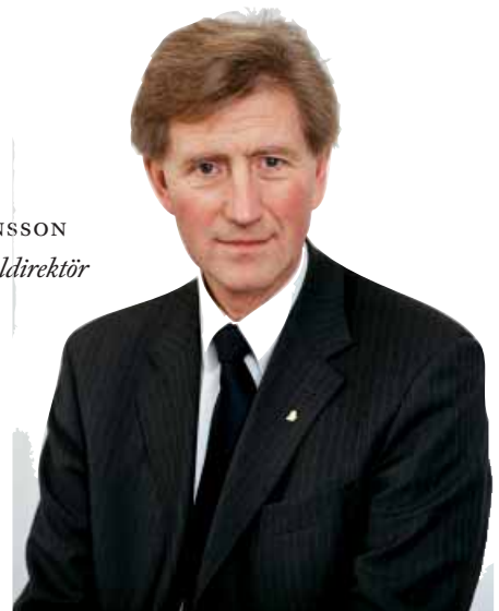
BO JONSSON Generaldirektör

SFV anser att de fastigheter RAÄ pekar ut faller inom ramen för det förvaltningsuppdrag verket har. De har också förutsättningar att ge ekonomiska överskott. De kan därmed bidra till att finansiera de nationella kulturarv av kungliga slott, befästningar med mera som ingår i verksamhetsgrenen Bidragsfastigheter. Dessa har inte förutsättningar att ge överskott utan går med stora underskott. I det perspektivet har SFV ett uppenbart intresse av att även ta över förvaltningen av ovan nämnda byggnader som inte prioriterats av RAÄ. De är kulturmiljöer av högt värde och i ett fall dessutom sedan länge förknippat med en fortgående statlig verksamhet.