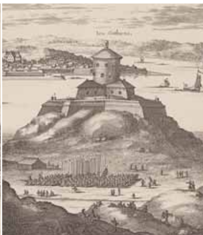
Skansen Kronan och skansen Lejonet ur Erik Dahlbergs Suecia Antiqua et Hodierna.