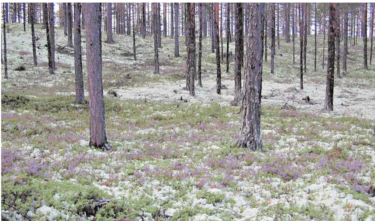
Den näringsrika renlaven är renens basföda under vinterhalvåret. Laven innehåller ett slags stärkelse, lichenin, som djuren kan tillgodogöra sig. Den har även samlats in av bönderna för att dryga ut tamboskapens vinterfoder.

Det finns bestämmelser i skogsvårdslagen som reglerar balansen mellan skogsbruk och rennäring. I de delar av norra Sverige