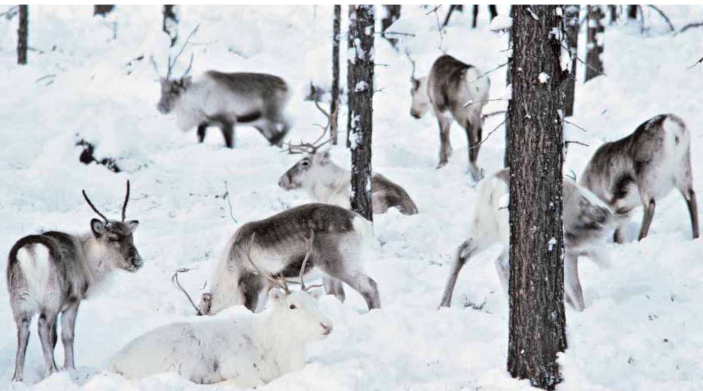
På hösten vandrar renarna ner från fjället för att hitta vinterbete i skogslandet.

– Fastighetsverket är bra att arbeta med. Framförallt uppskattar jag att de inte bara kommer med årets avverkningsplaner, utan att vi får vara med även i långtidsplaneringen. Då kan vi titta framåt och se hur rennäringen påverkas på sikt, säger hon. Det är bra. KV