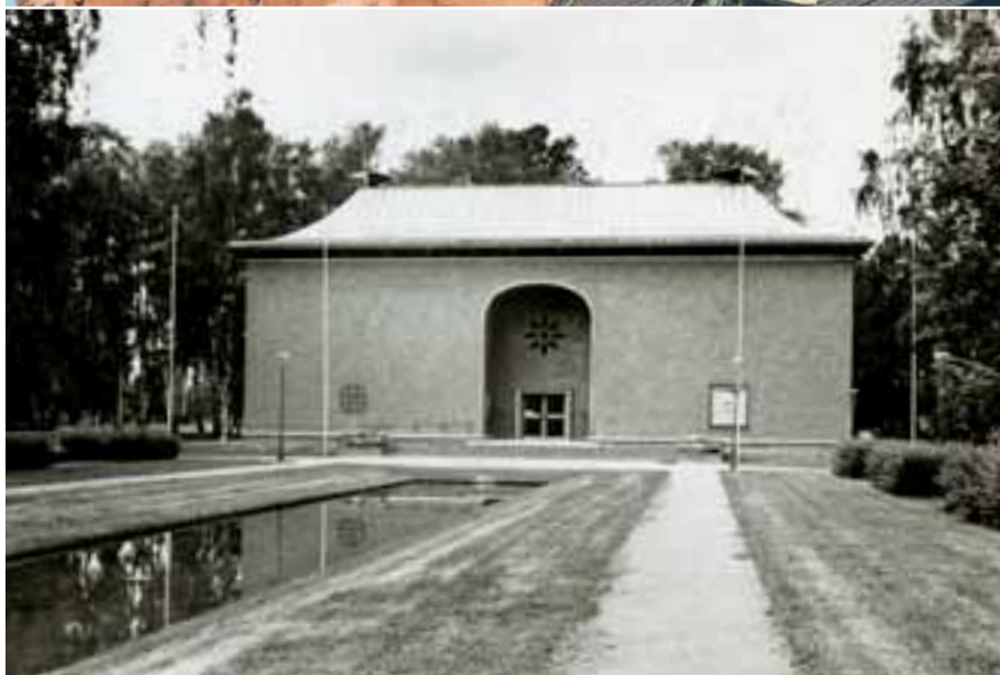
Överst. Centralposthusets kupol för tankarna till persisk-indisk konst och arkitektur.