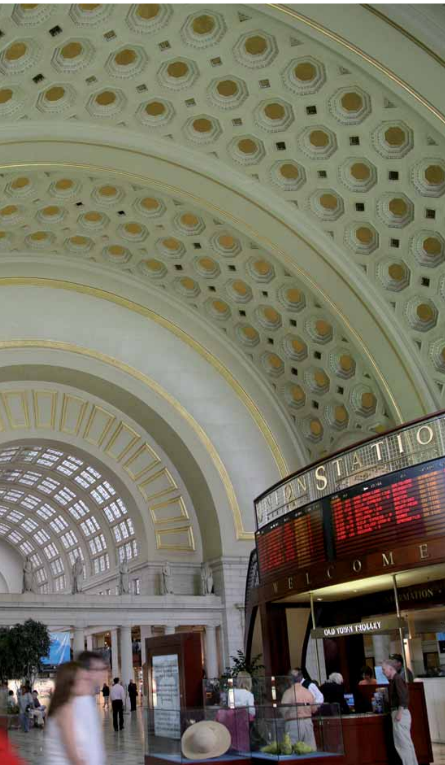
Cirka 20 miljoner människor passerar varje år genom Union Station i Washington.