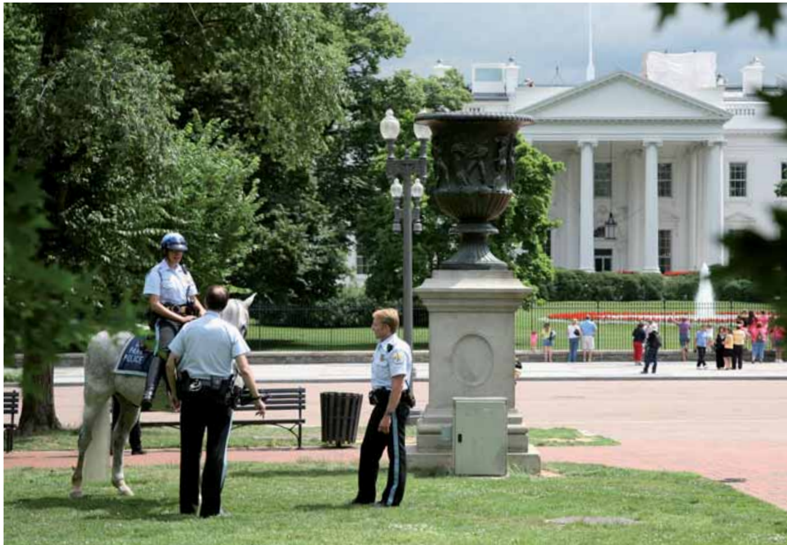
Poliser till häst och fots patrullerar Lafayette Park framför Vita huset där en demonstration mot kärnvapen har pågått i ett par årtionden, och ständigt nya protester mot president George W. Bush kommer till uttryck.

Georgetown. En ovetenskaplig studie, men staden ger onekligen en vink om att tempot är lägre här än på Manhattan, det finns tid och ro att läsa.