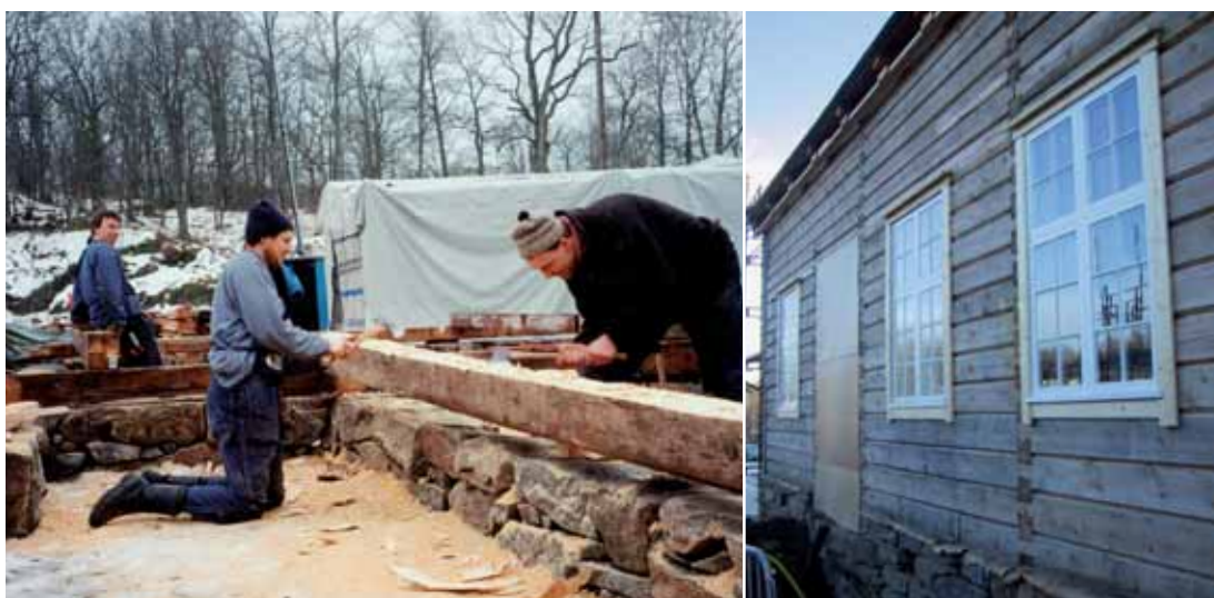
T.v. överst. Tjänstefolksbyggnaden med hönshus har fått inrymma Gunnebo Kaffehus och Krog.

Tjänstefolksbyggnaden med hönshuset var den första byggnad som rekonstruerades och uppfördes i projektet «Gunnebo åter till 1700-talet». Carlbergs ritning till detta hus fanns bevarad, men vid en arkeologisk undersökning av platsen visade det sig att byggnaden aldrig hade blivit uppförd. Rekonstruktionen uppfördes i alla fall efter Carlbergs ritningar med byggteknik och material typiska för 1700-talet. Byggnaden 'moderniserades' för att anpassas till dagens restaurang-